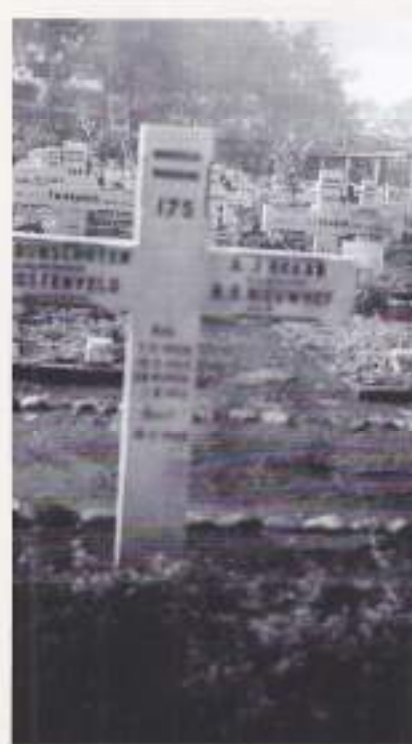
De hierboven genoemde 4 personen staan hier op één kruis vermeld. Vermoedelijk ook een foto van het oorspronkelijke graf

Zij zijn samen met nog een 13-tal mensen verongelukt (Padalarang a/b Dakota DT 947).