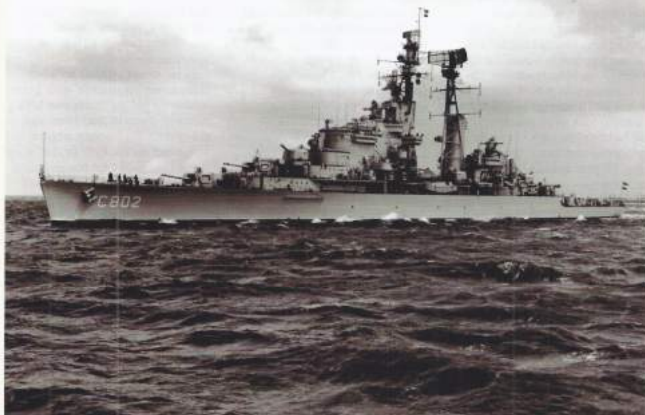
Hr. Ms. De Zeven Provinciën