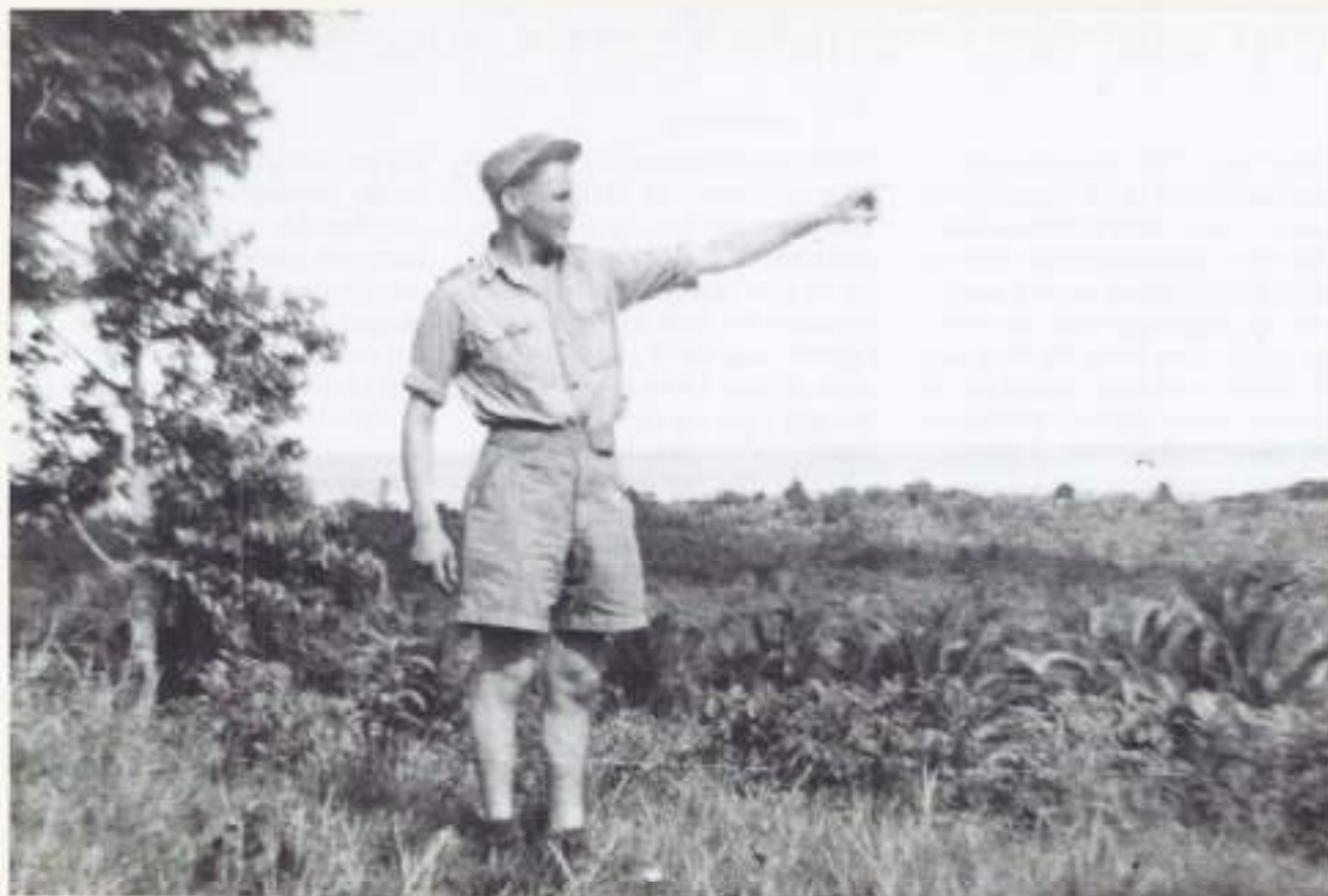
Daar ergens ligt Holland

ploeg scherpe voren in de zware kleigrond. Vogels zwermen er omheen en pikken op wat van hun gading is.