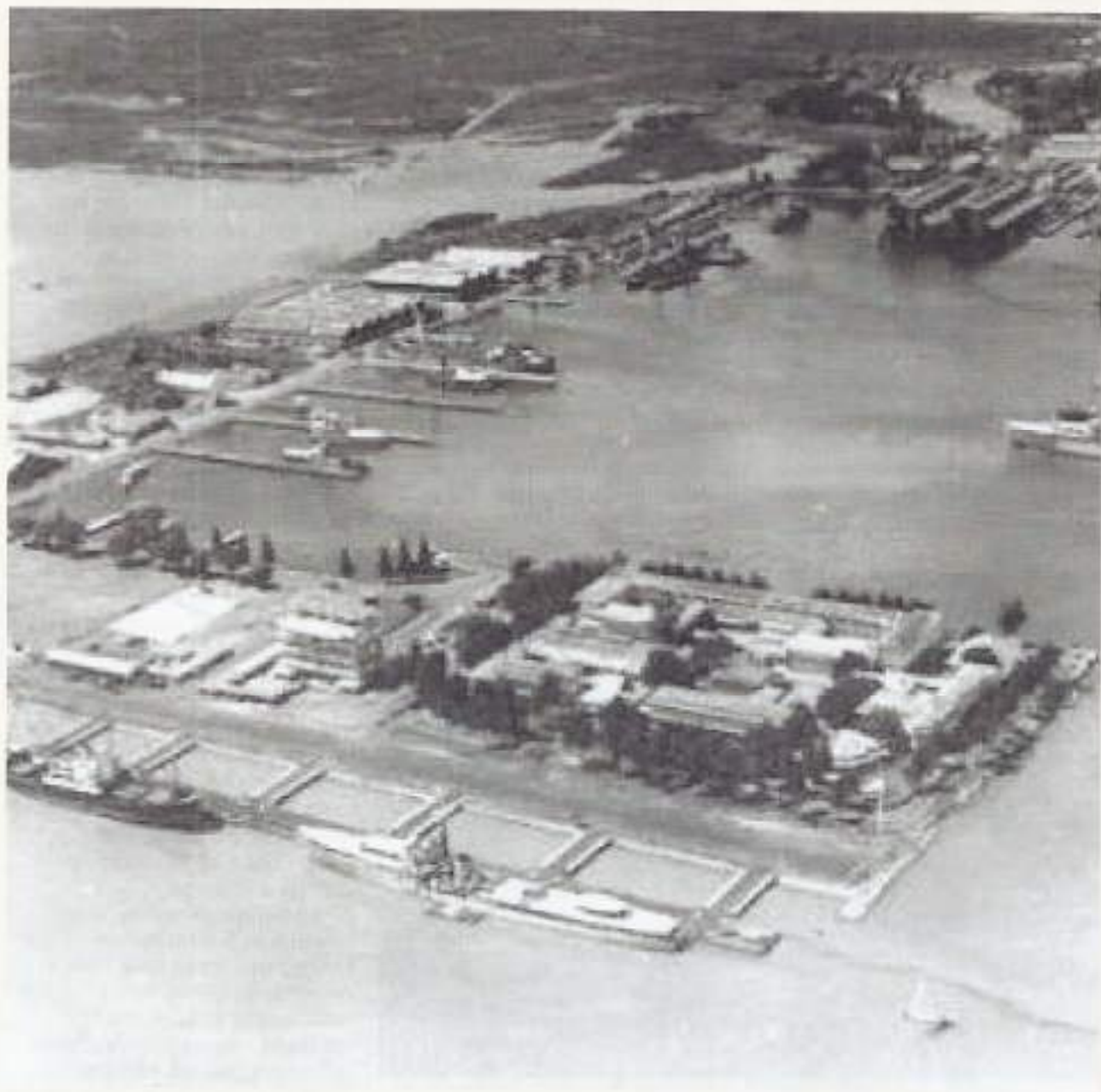
Marine Etablissement Oedjoeng (Soerabaja) met Krulserkade