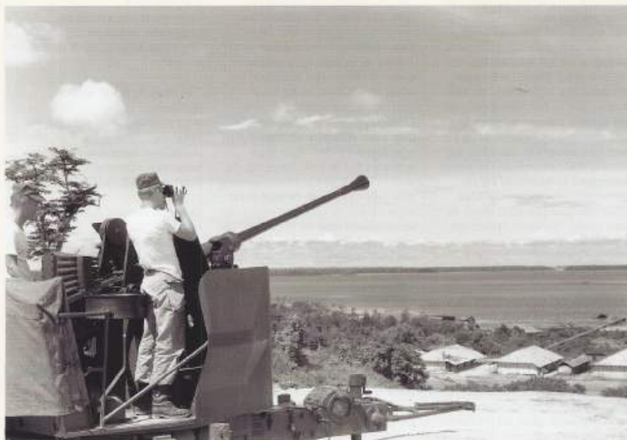
Bofors kanon 40 mm

dat ze dan weer te eten kregen en die vreselijke jungle achter zich konden laten. Ik heb een keer een aantal van hen naar ons gevangenkamp op Woendi mogen brengen. Een eiland dat vanaf Biak ongeveer drie uur varen was. Onderweg zag je vliegende vissen en als je aankwam, leek Woendi wel een Bounty eiland, zo mooi was het. Prachtige, brede, schone stranden met aan de rand hoge palmbomen vol met kokosnoten. Je had met die Indonesische jongens te doen. Die kleine, magere jochies die ook maar door Soekarno waren gestuurd. Hoewel ze met een serieus wapen in hun handen natuurlijk levensgevaarlijk waren, bij enkele infiltraties bleek dat dan ook. We hebben op Biak wel enkele malen echt alarm gehad. Indonesische vliegtuigen zouden naar ons onderweg zijn geweest. Biak met zijn vliegveld was dan het hoofdoel. Het is er