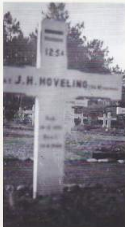
Vermoedelijk een foto van het oorspronkelijke graf

april 1948 te Tjimahl. Hij is herbegraven op het Nederlands Ereveld Pandu te Bandung.