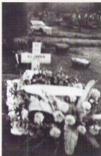
Vermoedelijk een foto van het oorspronkelijke graf