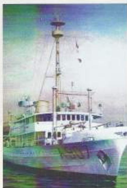
Hr. Ms. Snellius