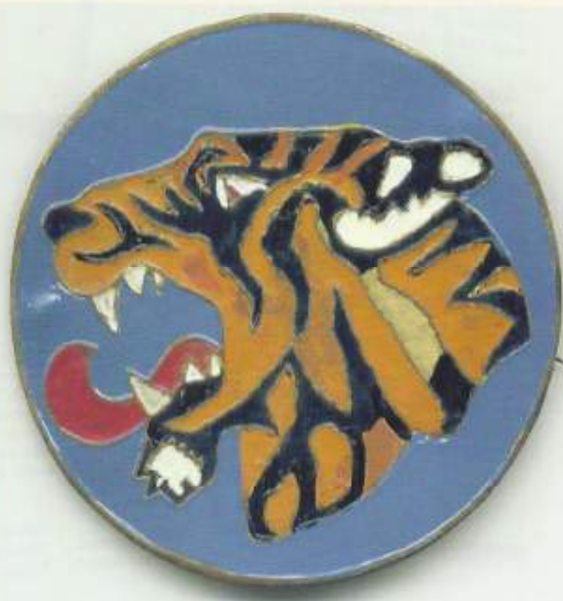
Nouwembleem 2-10 RI

Wiel Creemers, Montfort (L) OVW'er 2-10 en 2-15 RI, Oost-Java 1946-1949