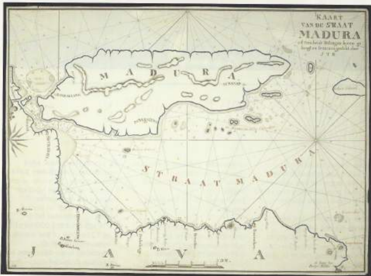
Straat Madoera is de smalle strook water die de Indonesische eilanden Java en Madoera scheidt.

en werd die voorraad voorlopig aldaar opgeslagen. In overleg met Matulesy liet ik door Kauwert en Sapoelette onze barang (die wij voorlopig niet nodig hadden) daar eveneens in opslaan, behalve mijn grote gereedschapskist die naar de machinekamer verhuisde met hulp van Patti en Manuhutu. Ruim -1- en -2- waren ca. 2.10 hoog, maar ruim -4- was maar ca. 1.80 hoog. Al deze ruimten waren kurk droog en dat was dus weer een voordeel. Al onze victualiën (provland) liet ik door Oom Sapoelette, Kauwert en enige Ambonese vrouwen opslaan in dekberging nr. 7, welke ruimte ons victualiemagazijn zou worden. Wat wij binnenkort nodig zouden hebben, ter beoordeling van de Ambonese vrouwen, ging meteen naar de kombuis. Inmiddels kwam Matulesy aanlopen met zijn verpleegkundige, Thomas Soepaheloet, die ook koffie kon zetten. Dat was een goed idee.