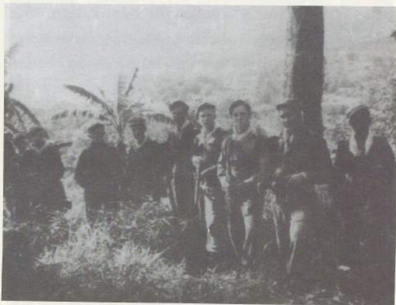
Het verkennen van het terrein

Het bruidspaar mag twee dagen lang niet eten en niet praten! Gedurende die twee dagen wordt de vrouw opgesloten en mag zij haar aanstaande man niet zien. Om te voorkomen dat ze die man toevallig toch zou zien, worden haar oogleden met een of andere substantie dichtgeplakt. Als de hele ceremonie is afgelopen, dan pas worden haar oogleden losgeweekt. Eerst dan komt ze te weten wie haar man is! Vóór het huwelijk verzoekt de man aan de ouders van het meisje toestemming om haar te mogen trouwen. Als de ouders met het verzoek instemmen mag het meisje de man niet afwijzen! Bovendien ontvangt de man ook nog een bruidsschat. Wat