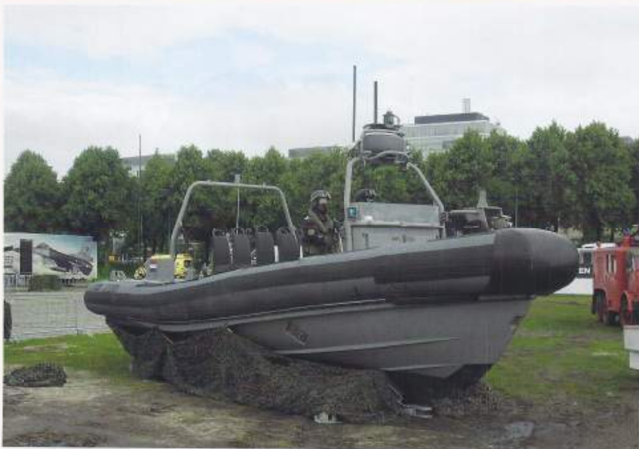
De dertiende Nederlandse Veteranendag is op zaterdag 24 juni 2017.