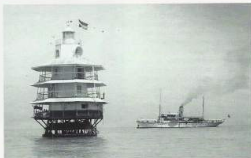
Vuurtoren 'Zwaantjesdroogte' in Straat Madoera