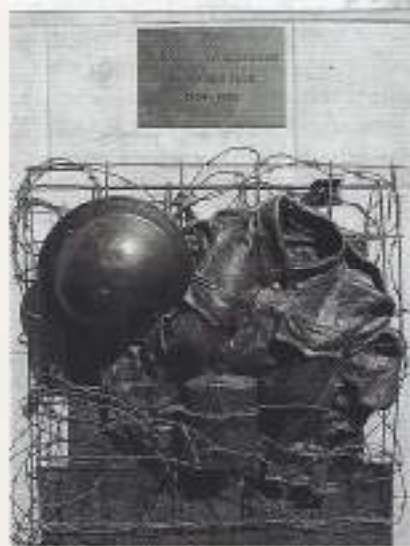
Museum 'De Bewogen Jaren'

de horeca, is bij de brandweer, waar hij zich opwerkt tot brandweerofficier. Nu leidt hij samen met zijn dochter 'De Bijenkorf' en is trotse museumdirecteur. Met een 25-tal vrijwilligers runt hij, als stichting, het fraaie museum (voorheen gevestigd op de zolder van het café, nu groots ingericht in de voormalige RABObank). Door de tatrijke reizen naar de Gordel van Smaragd heeft hij een enorme kennis van onze voormalige kolonie opgedaan. In een stortvloed van woorden draagt hij e.e.a. méér dan enthousiast over bij de museumbezoeker. De Indië kamer, met een enorme authentieke deur, is zijn grote trots. Het museum leidt tijdgericht rond door de roerige jaren van 1940 in Nederland en in het voormalig