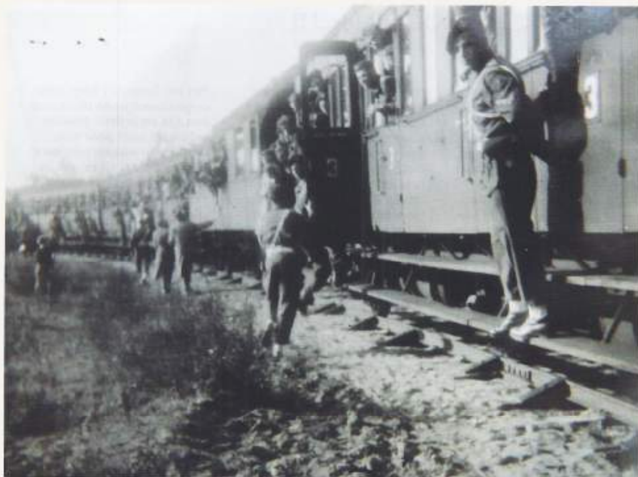
Marechaussees verhinderen dat eventuele deserteurs de trein naar Rotterdam zullen verlaten.