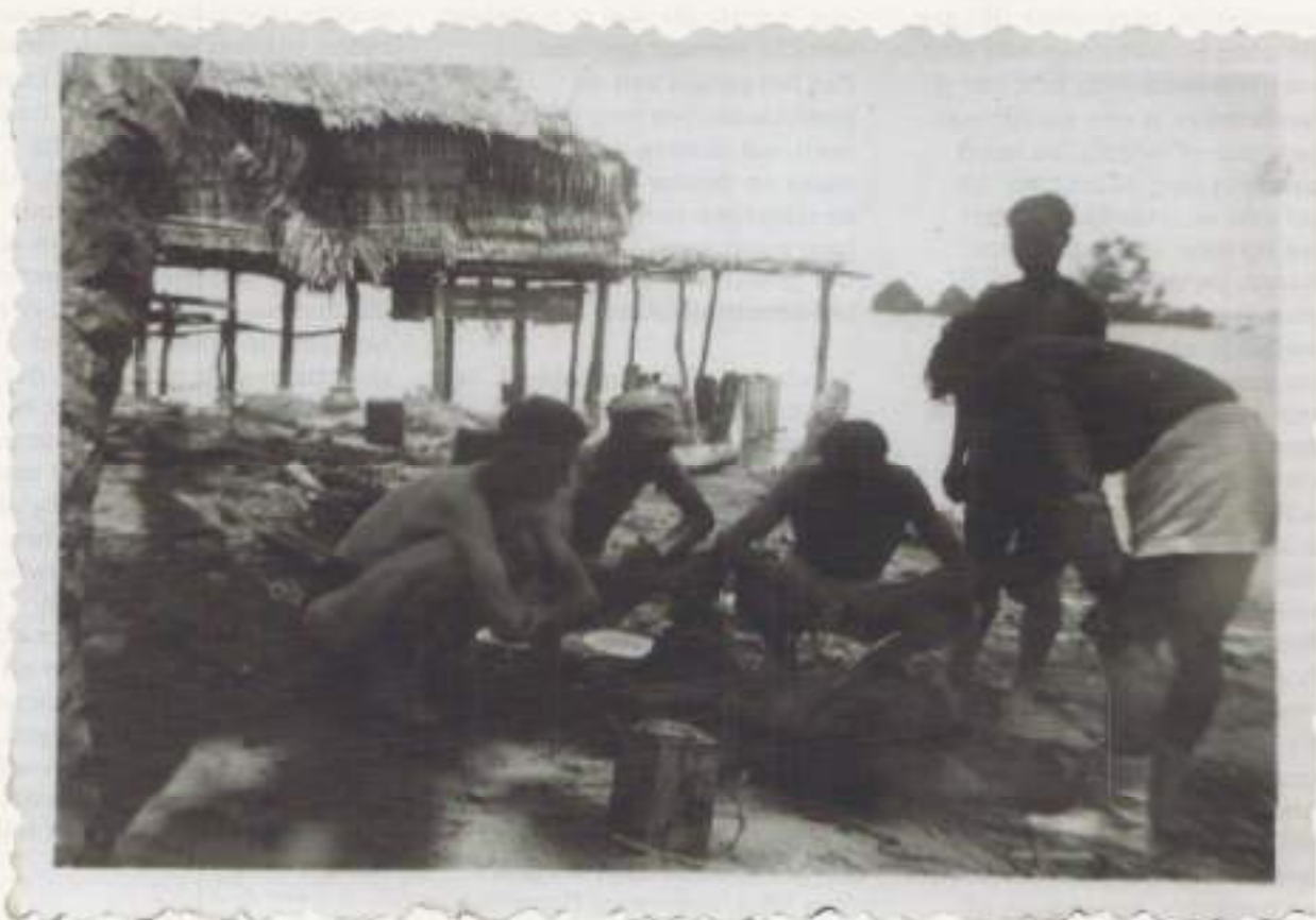
Geduldig zitten wij te wachten tot de kippensoep klaar is