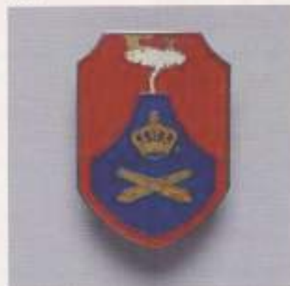
Embleem 6e Afdeling Veldartillerie / Y-Brigade / TTC Zuid Sumatra

volgen en daarna een deel van de lichter 1948 opleiden en encadreren en ga dan weer terug naar Indië, met 90% kans dat jij spoedig kunt volgen, doch dat staat nog niet zwart op wit.