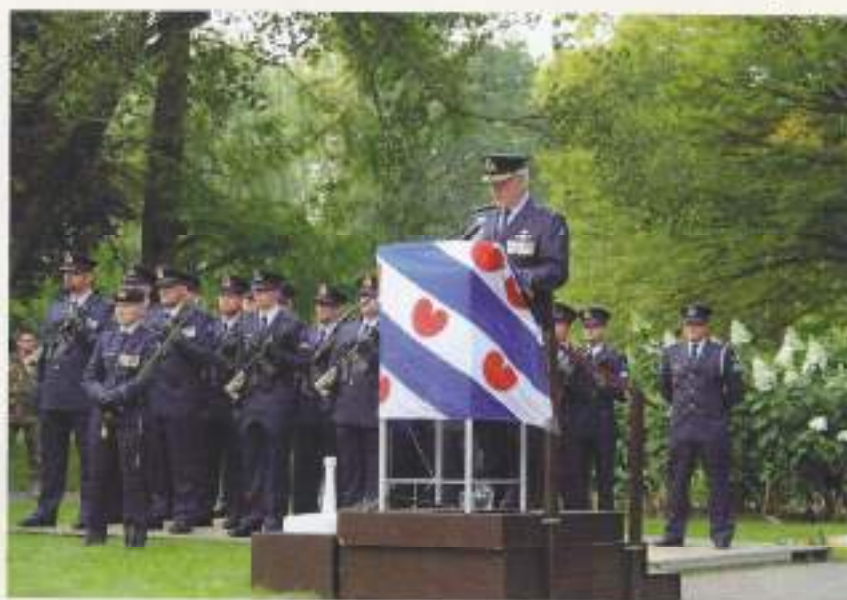
De Inspecteur-Generaal der Krijgsmacht (tevens Inspecteur der Veteranen).