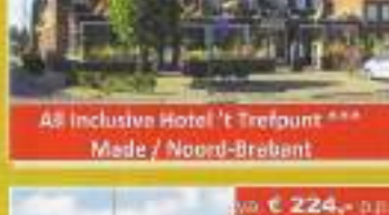
All Inclusive Hotel 't Trefpunt *** Mede / Noord-Brabant