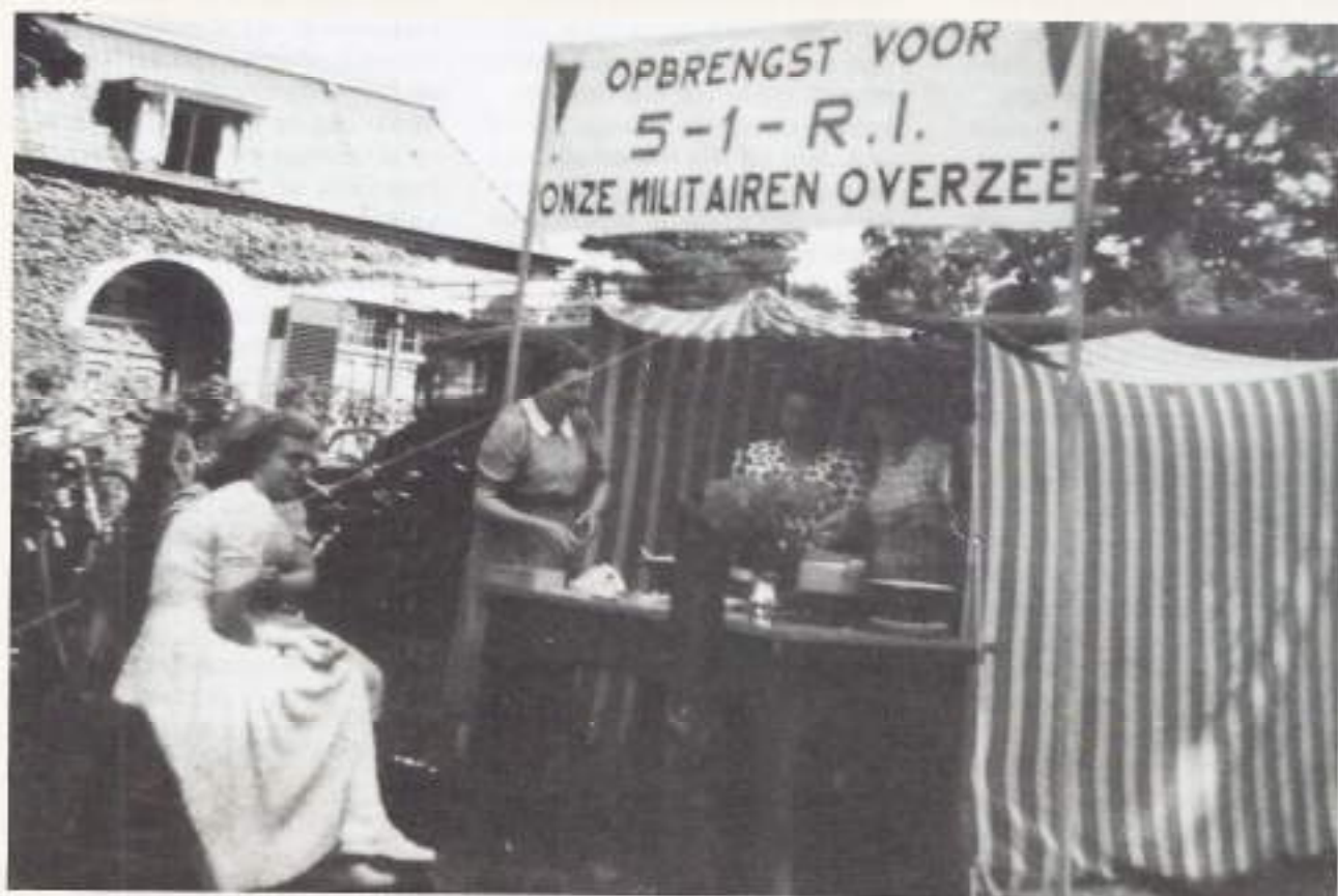
Dames uit Emmen

Feitelijk was de eerste politionele actie officieel al voorbij toen Dooltze voet op Indische bodem zette, want die duurde van 21 juli tot 5 augustus 1947. De tweede politionele actie begon formeel op 19 december 1948 en zou tot 5 januari 1949 duren. Voor de soldaten maakte het niet veel uit dat er een 'staakt-het-vuren' werd afgesproken (al op 5 augustus 1947) en dat er later een formele wapenstilstand tot stand kwam (in januari 1948). Het officiële Indische leger, de Tentara Nasional Indonesia, ging in toenemende mate over tot de guerrillastrijd tegen de Nederlanders, voortdurend waren er schermutselingen tussen beide partijen. De Nederlandse soldaten hadden geen idee tot wanneer zij hun dienstplicht zouden moeten vervullen.