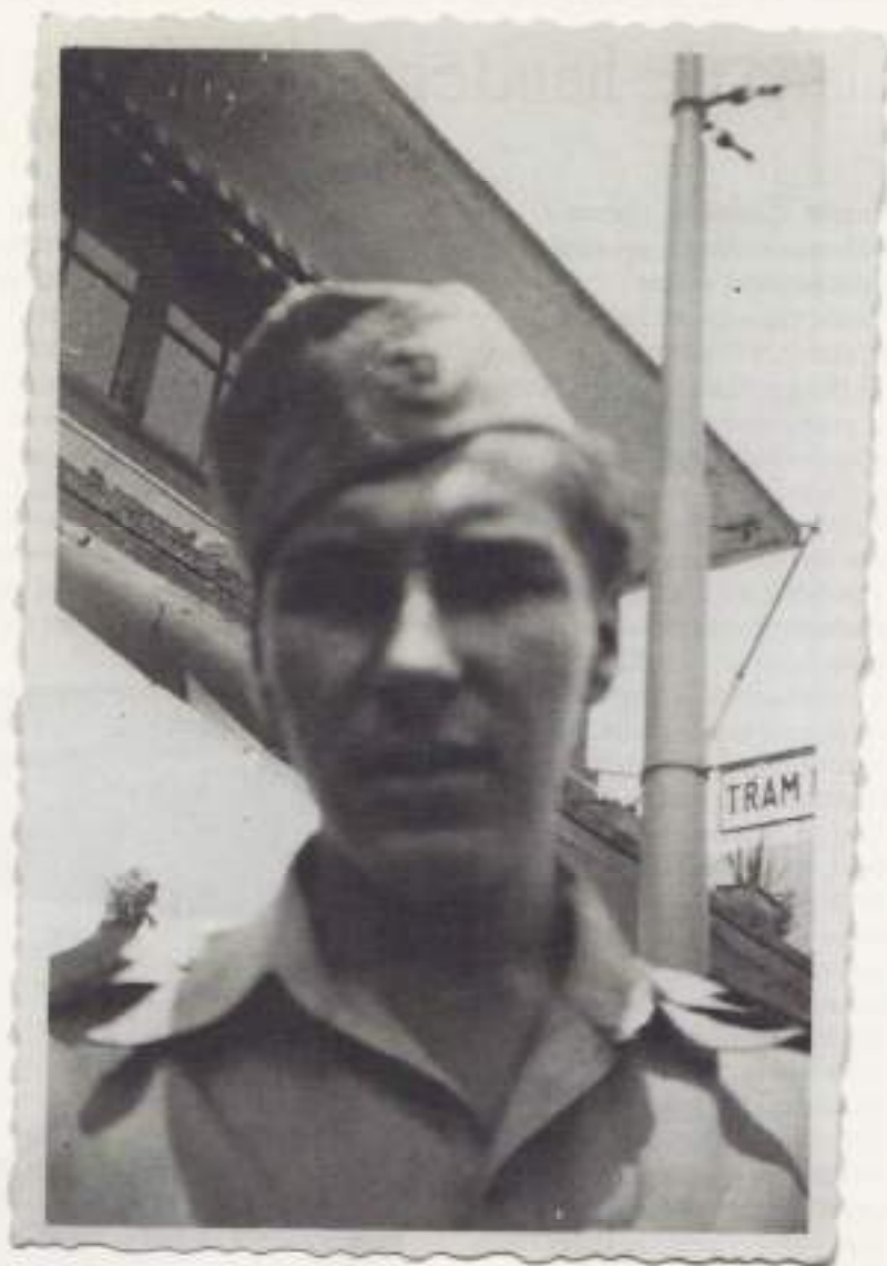
Borstfoto van saja

Reeds om vijf uur vanmorgen vertrekken we in de, hopelijk voor ons, goede richting. Even voor acht uur komen we uit op de plaats vanwaar we vier dagen geleden vertrokken zijn. Het blijkt dat we in een kringetje rond gelopen hebben. De vermoedelijke oorzaak is waarschijnlijk de aanwezigheid van metaal in het berggebied dat we hebben doorkruist. Het gebruik van een kompas blijkt in zo'n geval niet goed mogelijk. Hoe dan ook, we hebben geluk gehad dat we er zo van af zijn