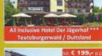
All Inclusive Hotel Der Jägerhof *** Teutoburgerwald / Duitsland