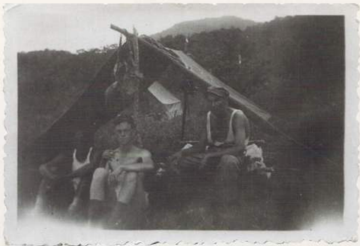
Onze slaappleaats tijdens de patrouille