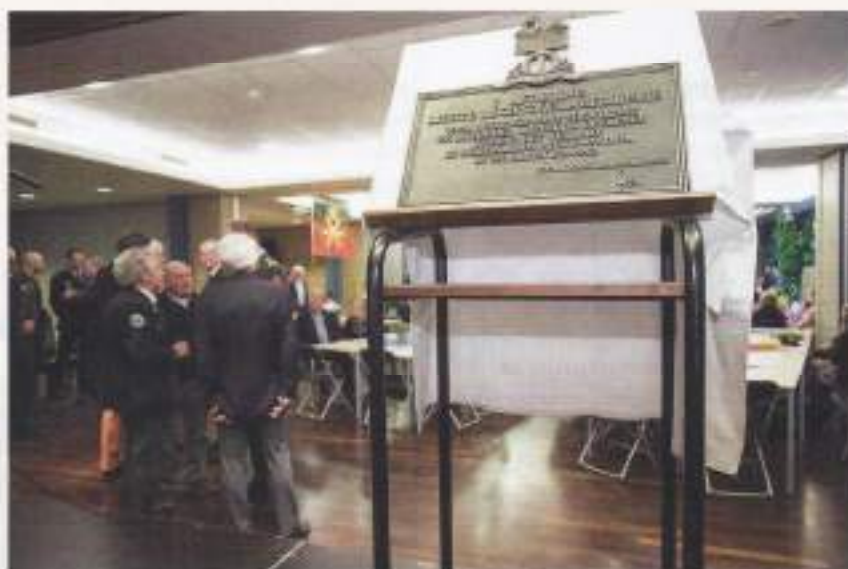
Het Bronzen Schild

Tussen eind 1958 en oktober 1962 werd de zelfstandige afdeling 'Biak' (het latere 7e Lichte Luchtvaartartillerie)