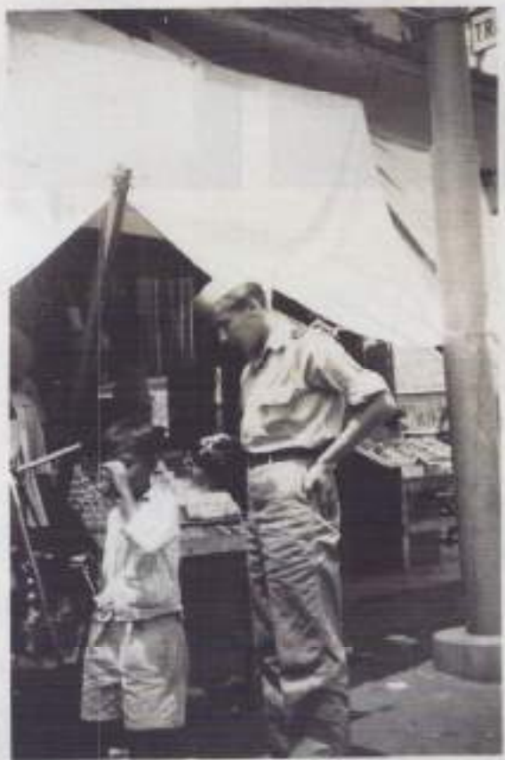
Even sigaretten kopen op de pasar

Het werd al schemerdonker, ik wist mezelf geen raad