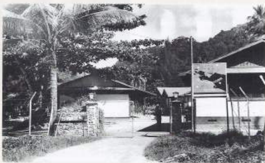
Hoofdboort kazerne Kalmana

hij gelukkig groots doorstaat. Zijn arbeidsethos altijd hoog in het vaandel, 'niet lullen maar poetsen' is zijn motto. Op 63-jarige leeftijd houdt hij het