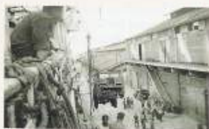
Oktober 1946 in Belawan aan de kade