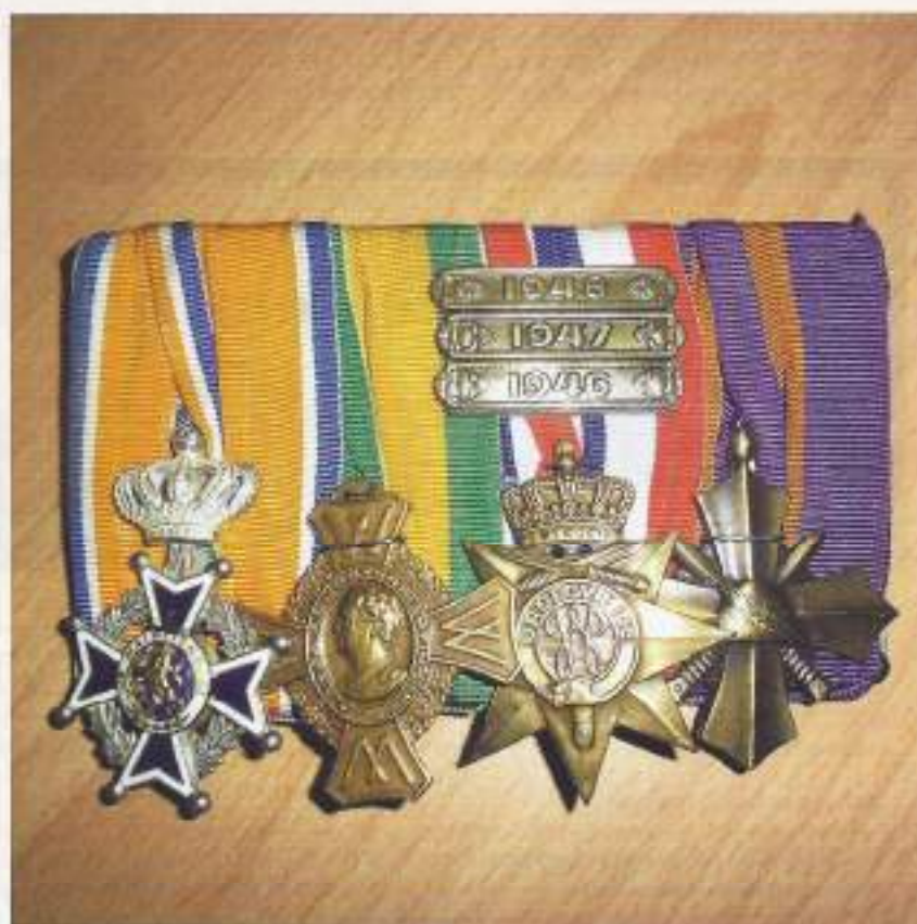
De vier onderscheidingen, v.l.n.r. Orde van Oranje-Nassau, Oorlogs-herinneringskruis, Ereteken voor Orde en Vrede (met drie Jaargespens) en het Mobilisatie-Oorlogskruis.