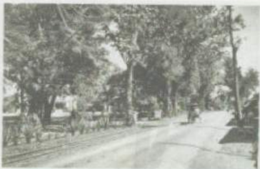
De Grote Postweg van Cheribon naar Bandoeng. Links de smalspoorbaan van de onderneming

De omgeving van Madjalenska was een gevaarlijk gebied waar zich veel TNI'ers schuil hielden.