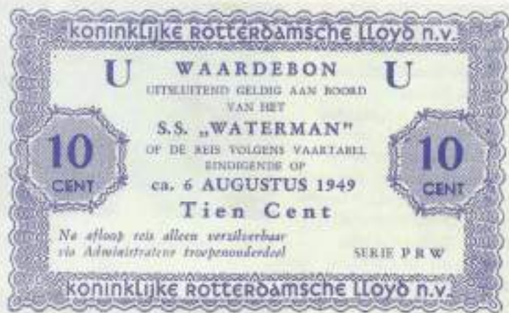
Boordgeld ss "Waterman"

"Erkenning en waardering staan voorop bij onze dienstverlening"