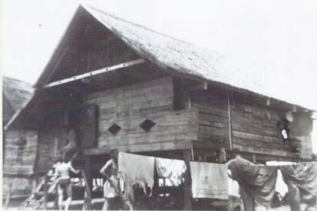
In dit huisje in Tjimpoe hebben we een nacht doorgebracht

Midden in de kampong stond een zendingsschool. Van verre kon je al duidelijk het gekrakeel horen van de kinderen, die daar les kregen. Toen ze ons in de gaten hadden, werd het angstig stil. Volgens de goeroe (godsdienstleraar) waren de