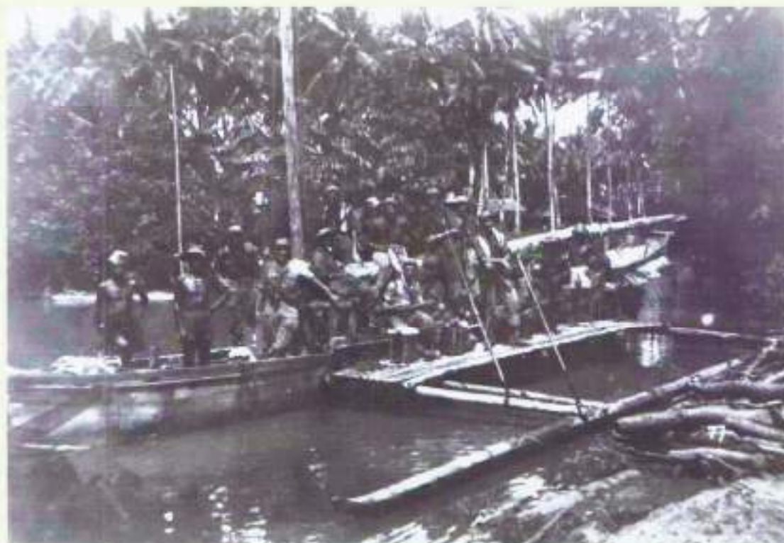
Met een prauw over de kali Soell

kinderen nog steeds bang voor soldaten. De Jappen bleken hier nogal te hebben hulsgehouden. Misschien ook wel de soldaten van kapitein Westerling. Wie zal het zeggen! Na een korte tijd was de angst bij de kinderen totaal verdwenen. Ze lachten en schreeuwden er weer vrolijk op los. Toen we afscheid namen, zwaaiden ze ons nog na tot we uit het zicht verdwenen waren. Om 13.00 uur gingen we bosbivak.