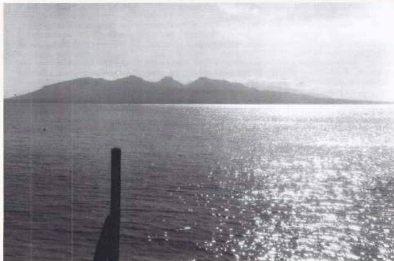
Straat Bali. Een zeestraat tussen de Indonesische eilanden Java en Bali. Het water vormt de grens tussen de Indonesische provincies Oost-Java en Bali en vormt een verbinding tussen de Indische Oceaan in het zuiden met de Balizee in het noorden.

Ik zag Alex rustig slapen aan bakboordzijde, waar de windvangers nog inzaten. Ik stak mijn duim op naar Manuhutu en ging weer naar dek. Ik liep