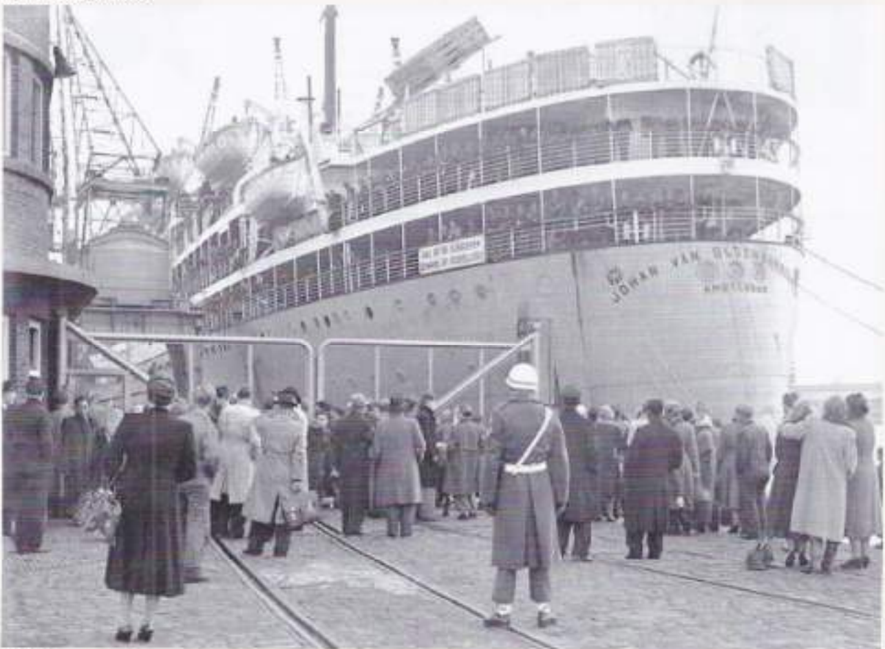
Ms 'Johan van Oldenbarnevelt'

Gelukkig heb ik met mijn (helaas overleden) echtgenote twee maal Java en Sumatra bezocht en natuurlijk ook Menteng Pulo