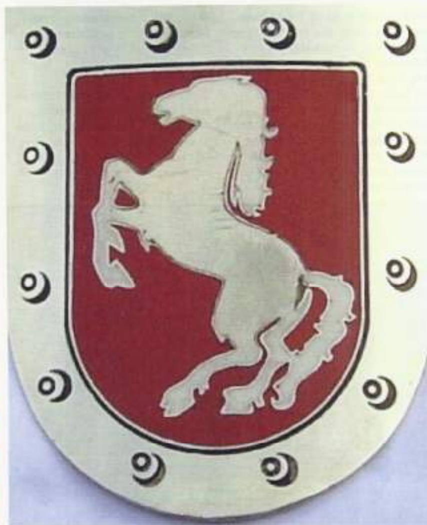
Bataljonsembleem van 5-5 RI (het Twentse stielgerend ros)

Het waren nog auto's, die je moest schakelen met 'dubbel clutch', dat wil zeggen dat je steeds bij het overschakelen naar een andere versnelling de koppeling in de vrijloop even moest laten opkomen. Je mocht pas naar de nieuwe versnelling gaan als je de koppeling voor de 2e keer had ingetrapt, vandaar de naam 'dubbel'. Als je moest terugschakelen naar een lagere versnelling moest je een extra dot 'tussengas' geven op het moment dat de koppeling in de vrijloop opgekomen was. Dat fenomeen hadden de jeeps, die we later in Indië hadden, niet, maar uit gewoonte bleef je het altijd doen want kwaad kon het niet. Tegen het eind van de rijopleiding moesten we leren