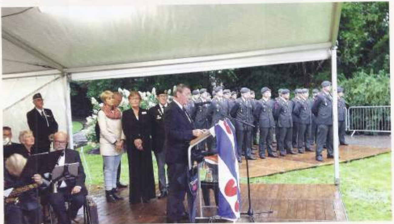
Voorzitter VOMI Nederland, generaal-majoor der Fuseliers bd Leen Noordzij

In de stromende regen werd op woensdag 30 augustus 2017 voor de 25e keer in het Rengerspark te Leeuwarden de jaarlijkse herdenking van de 168 uit Friesland afkomstige militairen, die in de periode 1945-1962 in Nederlands-Indië en/of Nieuw-Guinea zijn omgekomen, georganiseerd. Dit jaar werd de herdenkingsrede uitgesproken door voorzitter VOMI Nederland, generaal-majoor der Fuseliers bd Leen Noordzij.