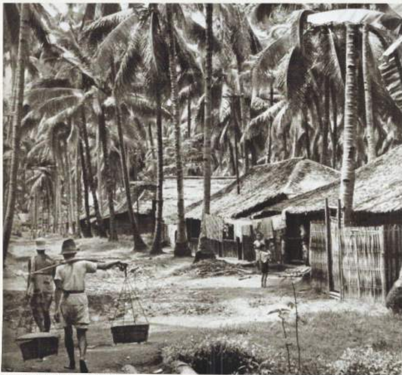
En kampong op Lombok (1950)