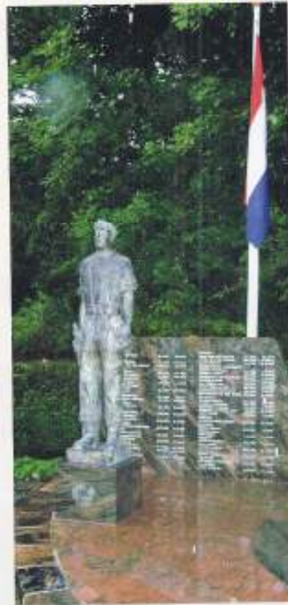
Het nieuwe bronzen beeld