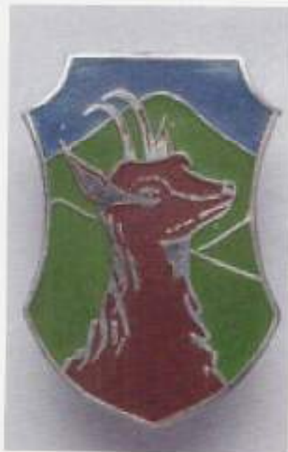
Onderdeelsembleem 4-2 RI (Gemenbataljon)

's-morgens om half vijf werden de dekken reeds schoongespoten met koud zeewater. Dan moest je maar maken dat je weg was, waarschuwen deed men niet. Ook waren er maten die constant zeeziek waren, dat was rampzalig. Eten konden ze nauwelijks en als ze wat hadden gegeten, hingen ze prompt over de railing en waren dan hun eten weer kwijt. Een nieuwe ervaring was het ook dat we op weg naar Indië steeds met een nieuwe tijdszone te maken hadden. De klokken diende dan vooruit gezet te worden. Tijdsverschil Sumatra en Nederland: plus zes en half uur.