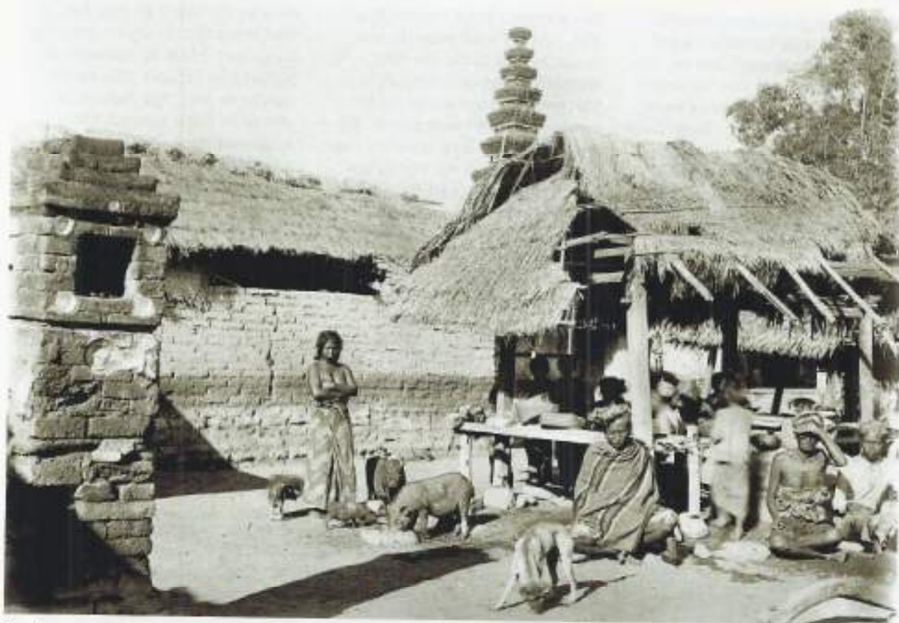
Een kampong op Bali (1950)

oost ten zuid, mede om het eventuele tegen roer straks in Straat Lombok te compenseren. Het is in ieder geval te proberen, mede omdat ik morgen omstreeks deze tijd dan voor de kust van kampong Peloean zou kunnen ankeren om te fourageren. Het enige wat mij nu nog te doen stond was een gegist bestek op te maken en koos daarvoor uit de Goenoeng Batoekaoe met zijn piek van 2500 m, de Goenoeng Agoeng met zijn piek van 3200 m, met daarvoor de Goenoeng Abang met ruim 2500 m, op Bali.