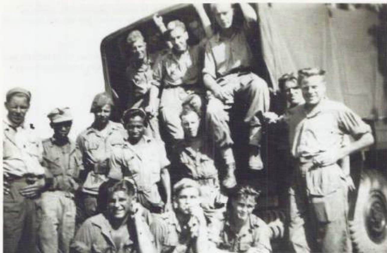
Enkele mannen uit ons peloton

In het verdere verloop van de dag zijn we nog twee kali's overgestoken. Gelukkig konden we hiervoor gebruik maken van de prauwen van de bewoners uit de kampongs Sampano en Leworang. Moe maar voldaan betrokken we tegen de avond een leegstaand huis in kampong Leworang.