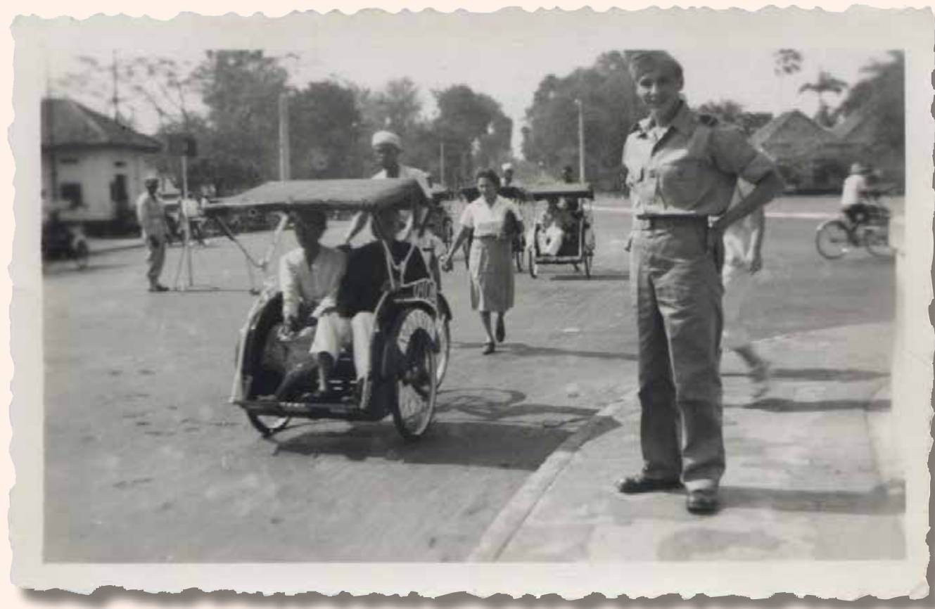
In hartje Batavia

De volgende dag word ik met zware hoofdpijn wakker. De zee is weer erg onrustig. Door de sterke deining slingert het schip flink heen en weer. Ik doe een poging een brief te schrijven wat echter niet al te best lukt. Als ik aan dek kom, voel ik de sterke wind die over het wateroppervlak jaagt. De dag sleept zich voort, moeizaam en eentonig. Naarmate de dag vordert, stijgt de hitte in de loodzwarte lucht. De hele dag jaagt de boegzwermen vliegende vissen uit de witschuimende golven op. Een prachtig gezicht.