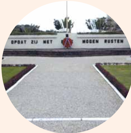
Ereveld Menteng Pulo