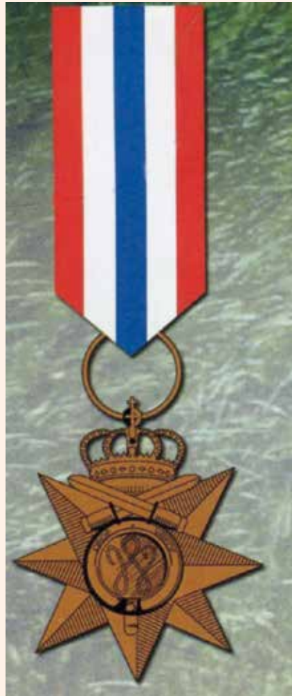
Ereteken voor Orde en Vrede

'Mijn schoonzons, drie, van wie er twee nog in leven zijn, hebben het niet gewaardeerd dat ik daar als dienstplichtig militair indertijd heen gestuurd ben. Toen wij weer terugkwamen uit Indië, was er geen enkele erkenning of waardering, van niemand. Vooral niet van de Nederlandse regering, die ons er juist heen