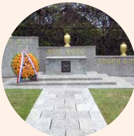
Ereveld Kembang Kuning