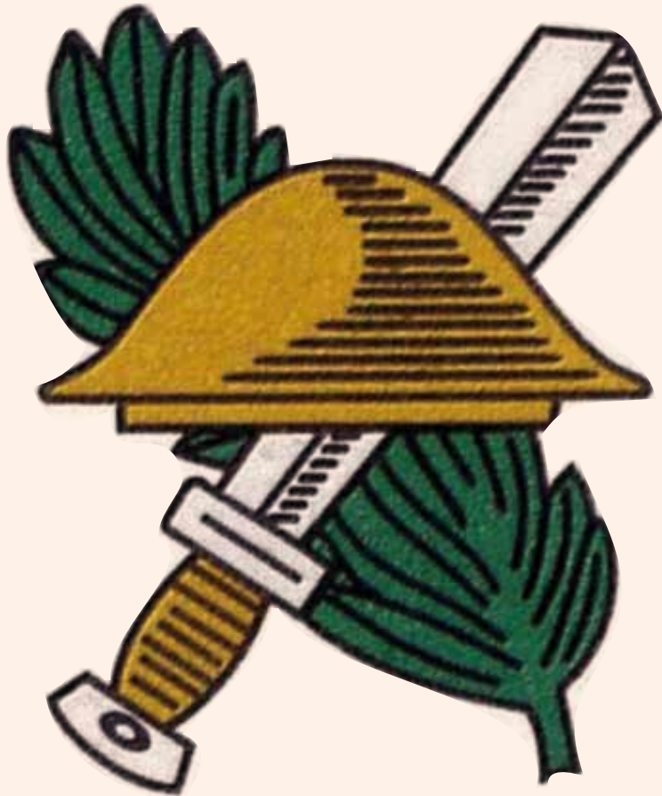
Demobilisatie-insigne Nederlands-Indië (KL)

zaten, werden we nog steeds beschoten door de Japanners vanaf die tjom. Ik heb dat dus overleefd, maar ik weet niet meer hoe we uiteindelijk weer in ons kamp teruggekomen zijn. Het is wel allemaal 70 jaar geleden, hè'.