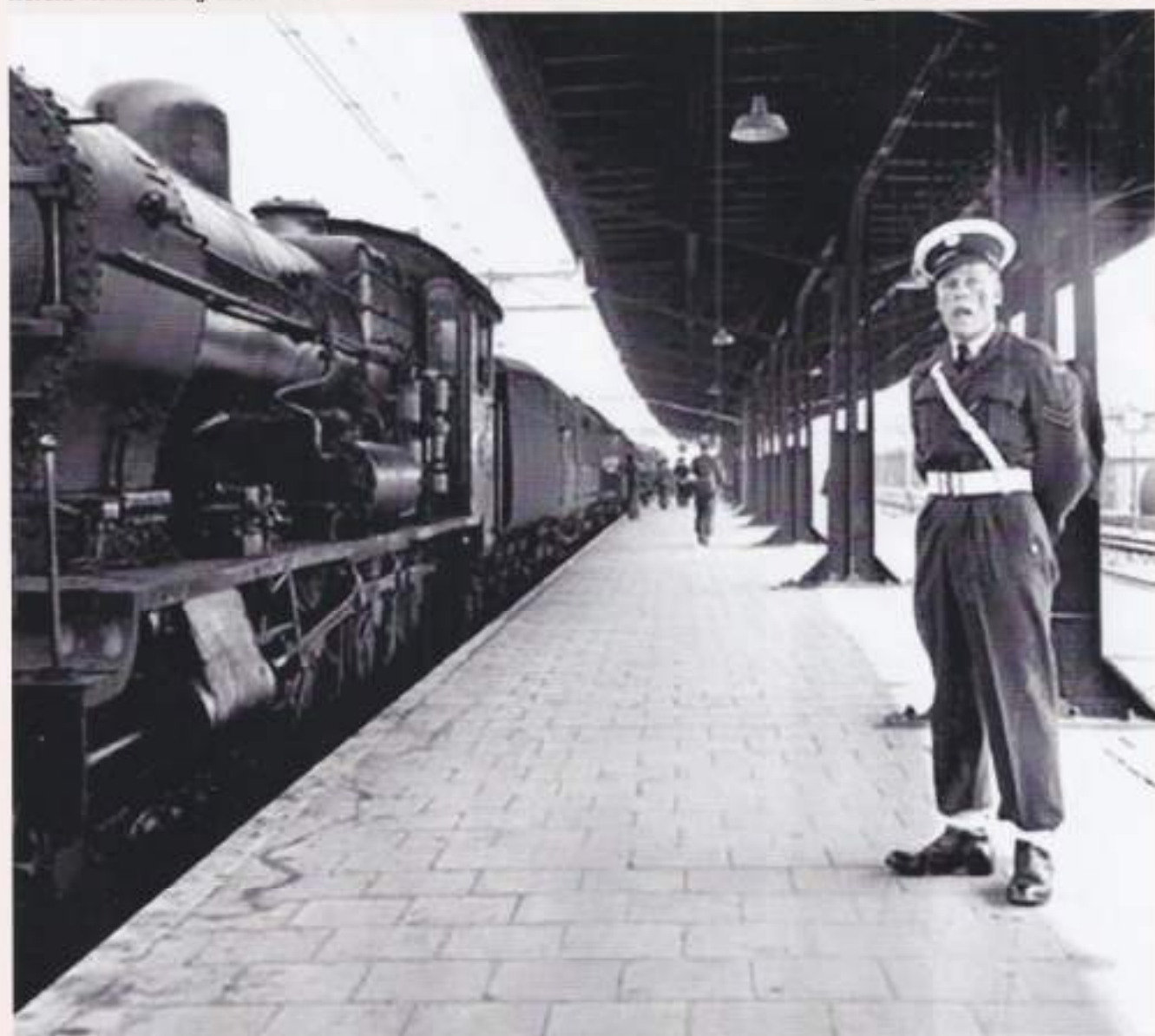
Marechaussee ziet toe op het Station Staatsspoor, 's-Gravenhage 1948

derweg in de stadstram al had gezien. Hij bleek vrij dicht bij mij in de buurt te wonen, hoewel ik hem eerder nog nooit had ontmoet. Ook hij moest zich in Teuge melden bij hetzelfde militaire onderdeel waar ik naar op weg was. Hij stelde zich voor als Mollerus en vertelde erbij dat hij Jonkheer was. Van adel en dus goed gezelschap. Onze coupé (de wagons waren verdeeld in