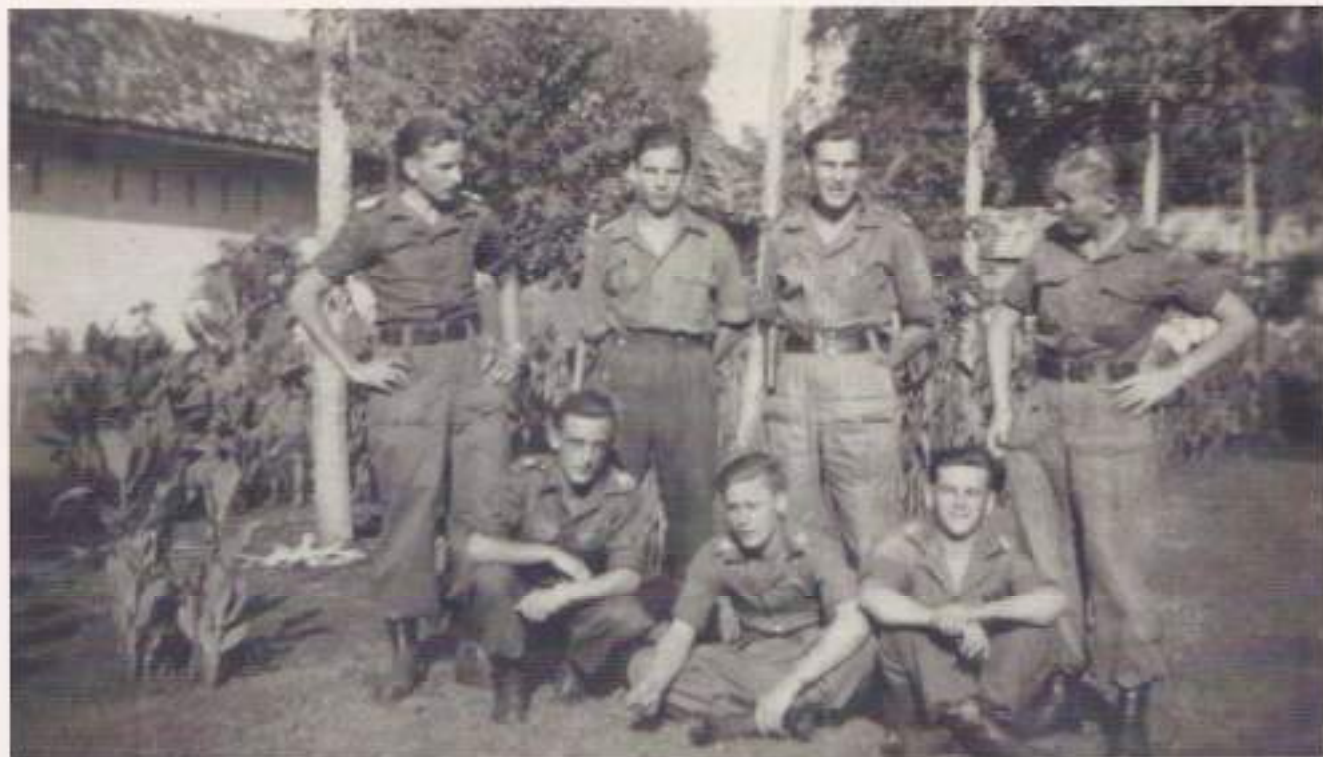
Met een deel van de wacht in de tuin van Generaal Spoor

Bijna twee maanden zitten we nu alweer in Batavia. Van een grote aanval door de TNI op de stad is niets gebleken. In plaats van actievoeren worden we nu gebruikt voor het verrichten van wachtdiensten bij het huis van Generaal Spoor, patrouilleloper in de kampongs en sinds kort ook voor het begeleiden van treinkonvoeien. Het beschieten van treinen is hier aan de orde van de dag. Vooral de goede-