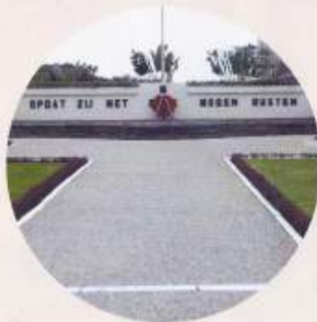
Ereveld Menteng Pulo