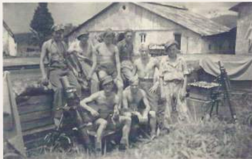
Opa met kameraden