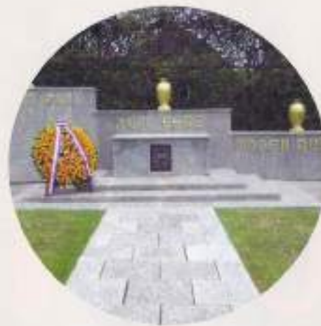
Ereveld Kembang Kuning