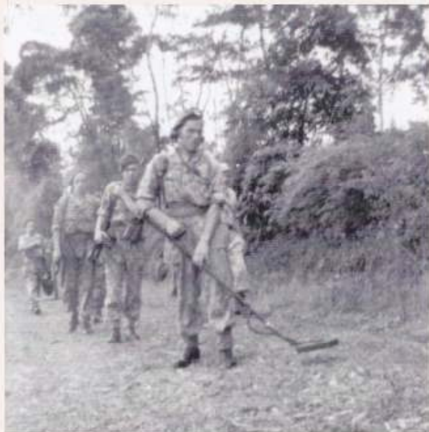
Hier leren de pioniers mijnen zoeken met een detector

De eerste tijd was het regelmatig rijden met de pioniers die verschillende klussen moesten doen o.a. bij Sumowono, waar een schietkamp was op de helling van de Ungaran. Even verderop moest een weg, die verdwenen was, weer tot weg worden gemaakt. Deze liep langs een berghelling, maar de ploppers hadden deze schuin afgegraven. Om dat te herstellen moest het nodige graaf- en stutwerk worden verricht en ik bracht de jongens daar naar toe met hun materiaal en gereedschap.