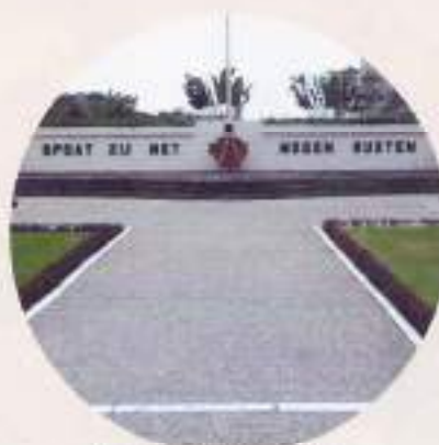
Ereveld Menteng Pulo