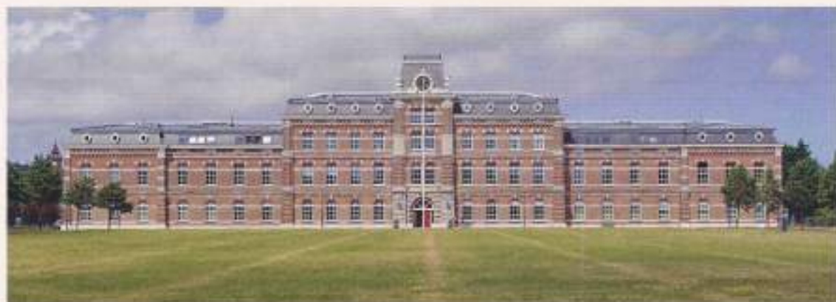
Hoofdgebouw Ripperdakazerne Haarlem

terleel, zware GMC-vrachtauto's en indrukwekkende Harley-motoren aanwezig was. Later bleek dit spul ook ons 'lesmateriaal' te zijn.