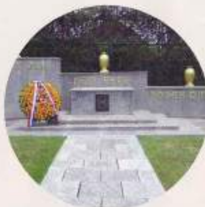
Ereveld Kembang Kuning