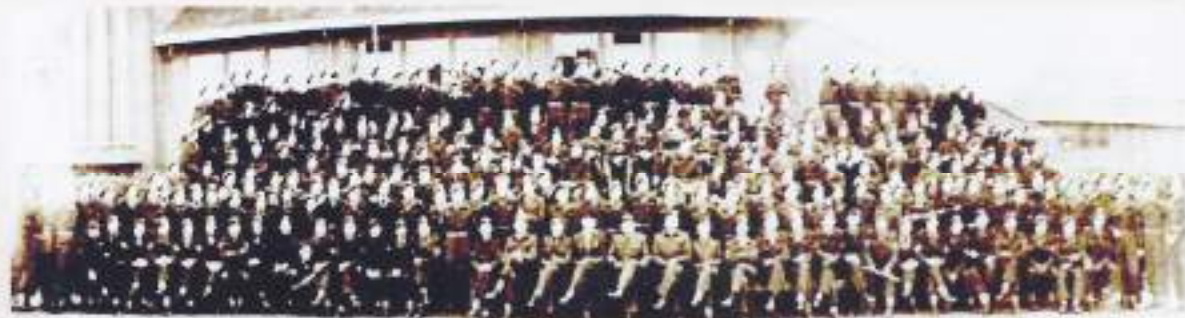
Groepsfoto van de nog maar net geformeerde 42e Brigade Transportcompagnie