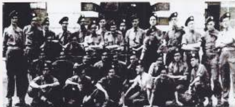
Het SRO-peloton met instructeurs voor de ingang van het hoofdgebouw van de Ripperdakazerne