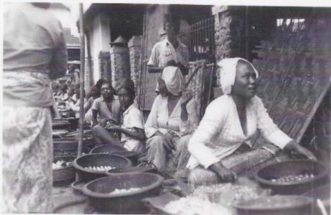
Op de markt

Af en toe mochten we in Semarang gaan passagieren. We konden een bezoek brengen aan de bioscoop. Het leukste