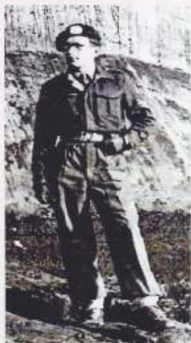
Als sergeant naar het Indië-onderdeel 42 AAT in Grave

kraag (daar zaten destijds de rangonderscheidingstekens) mochten aanbrengen. Het moment naderde dat we overgeplaatst zouden worden, om ingedeeld te worden bij het onderdeel waarmee we naar Indië zouden vertrekken.