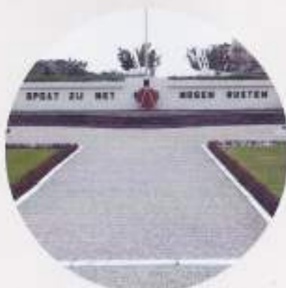
Ereveld Menteng Pulo