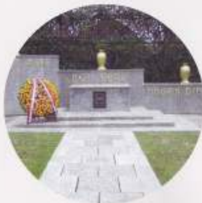
Ereveld Kembang Kuning