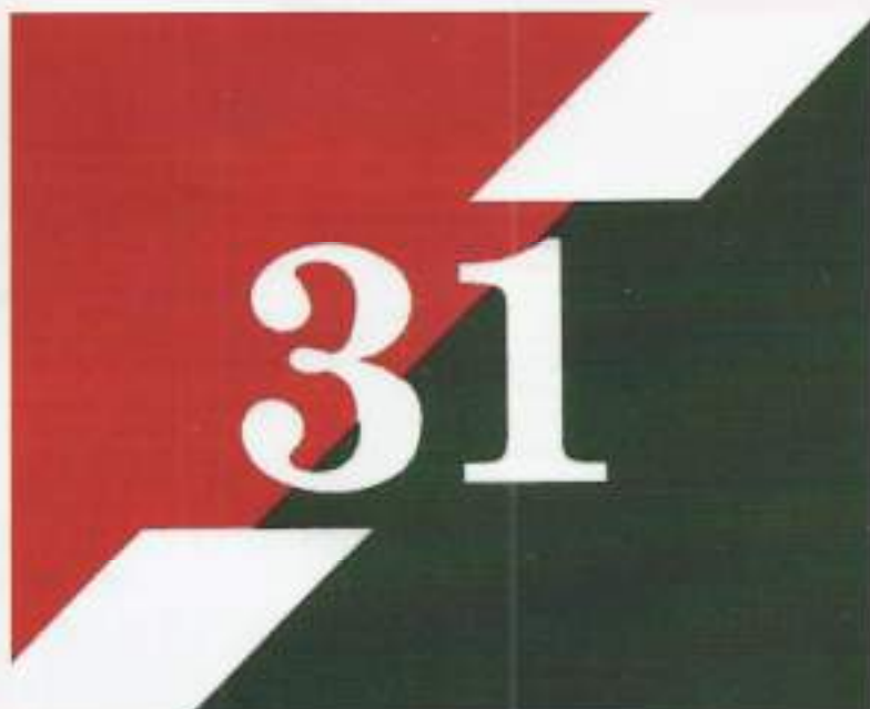
Het tactische herkenningnummer 31

Onze 42e Brigade Transportcompagnie werd zoals gebruikelijk bij AAT compagnieën na aankomst in Indië aangeduid met 42 AAT. Daarnaast kreeg de compagnie het tactische herkenningnummer 31. Alle AAT compagnieën voerden als teken het rood-groene, diagonaal gedeelde vierkante vlak. Daarin was het tactische