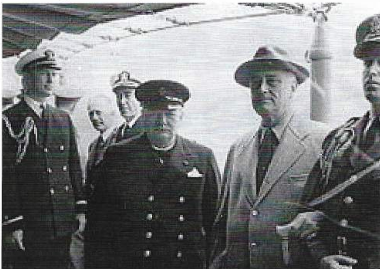
Het Atlantisch Handvest was een besluit op de Conferentie van Placentia Bay door de Eerste minister van Groot-Brittannië Winston Churchill en de president van de Verenigde Staten van Amerika Franklin Delano Roosevelt op de kruiser USS Augusta (CA-31) die voor anker lag in de Baai van Placentia in Newfoundland. De gezamenlijke verklaring van het Atlantisch Handvest werd uitgegeven op 14 augustus 1941.