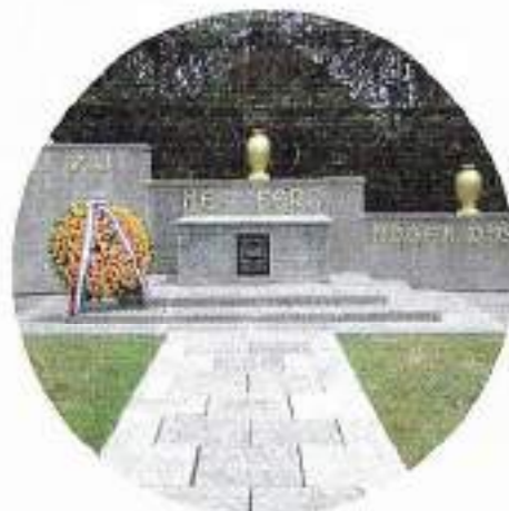
Ereveld Kembang Kuning