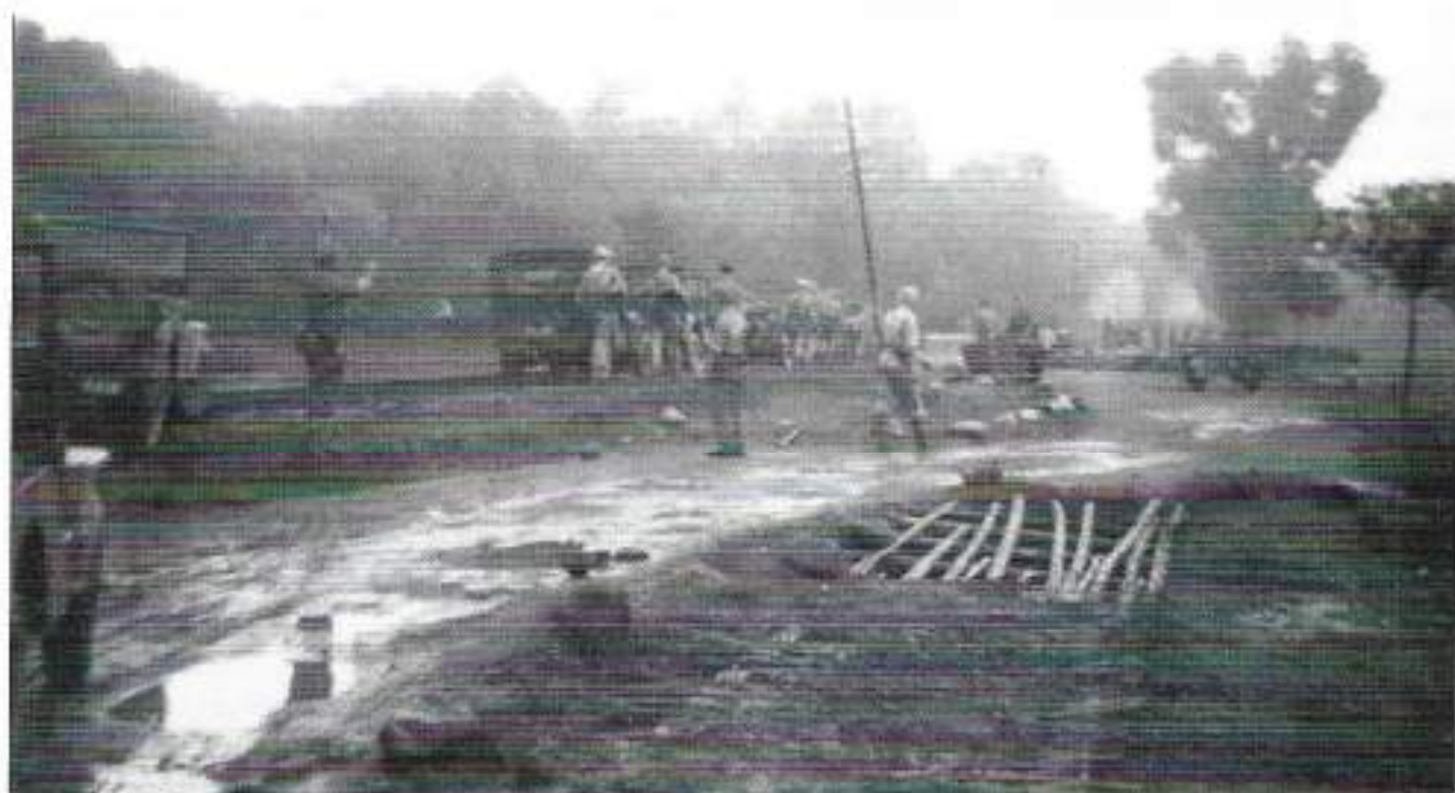
Op de foto hierboven zien we rechtsonder in de weg een soort tankval, die met bamboematten is gecamoufleerd.