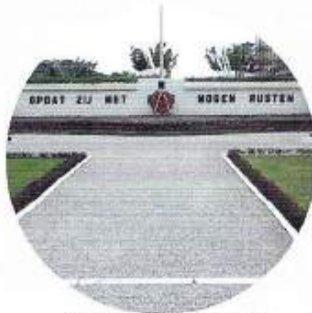
Ereveld Menteng Pulo