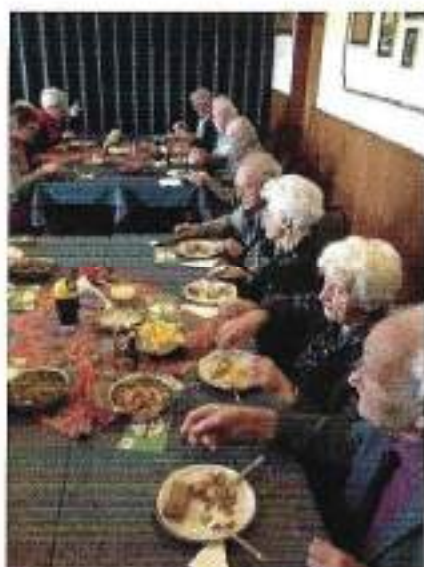
Een fijne varkenshaas met champignonroomsaus liet men zich goed smaken

Om 09.30 uur was het bestuur aanwezig om de gasten te verwelkomen, terwijl de eerste belangstellenden al binnen waren. Na het inchecken werden onze gasten door voorzitter Kees Eijkelenboom welkom geheten. In zijn toespraak werden de overledenen gememoreerd en herdacht met een minuut stilte. Ook werd er stilgestaan bij de nestor van onze vereniging sobat Goossem Boers, de laatste der Mohikanen, die de onderafdeling Assen