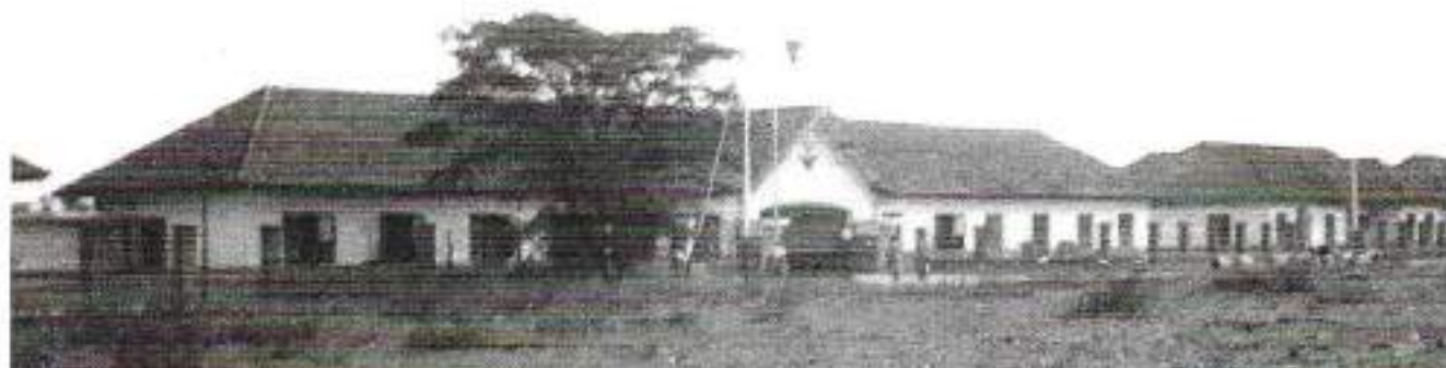
Voorraanzicht van de Kromhoutkazerne in Soerabaja. Het eerste onderkomen voor 42 AAT na aankomst op Oost-Java

zijn weggelegd. Maar dat zou heel anders uitpakken. Ook na de actie ging de guerrillaoorlog, zoals ook daarvoor was gevoerd, gewoon door en nam zelfs in hevigheid toe. De gevolgen daarvan zouden we al spoedig merken. Na aankomst wordt 42 AAT, waaraan als tactisch nummer 31 is toebedeeld, onder commando geplaatst van de Territoriale (Divisie) Verplegings- en Transport Officier van het Territoriaal tevens Troepencommando Oost-Java (A-Divisie).