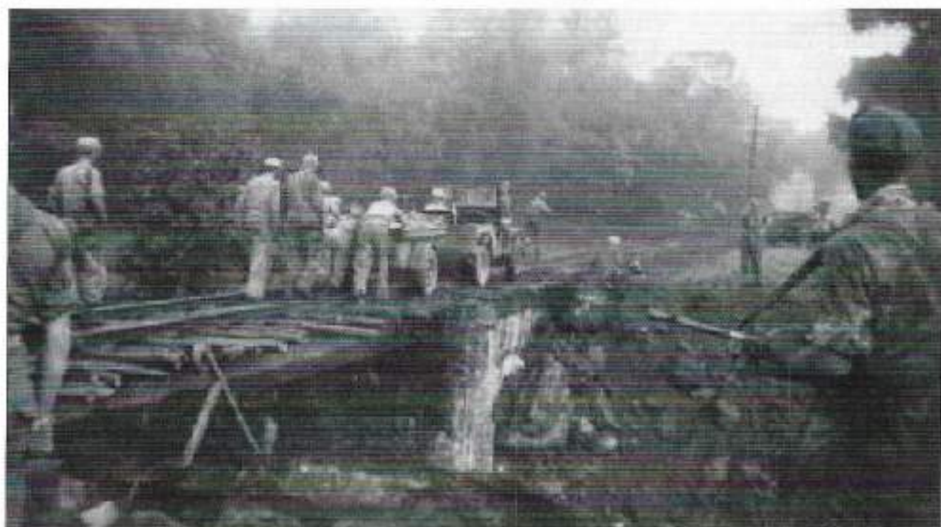
Hier gaat een jeep over de rails. Tussen de bielzen zijn extra balken en stukken bamboe gelegd om het mogelijk te maken er over te rijden met behulp van enkele duwende sobats.