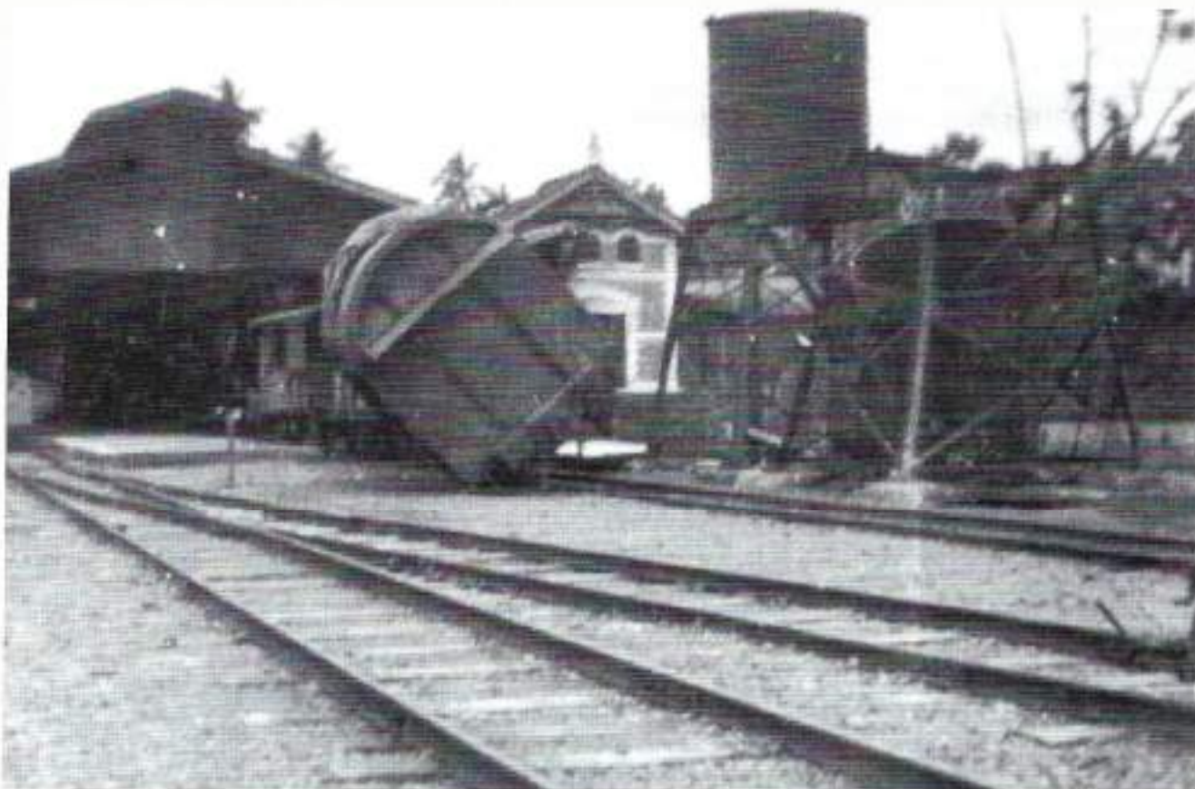
Het verwoeste station in Temangung

mitralleurs in een kruisvuur, waarbij Visscher op slag dood was.