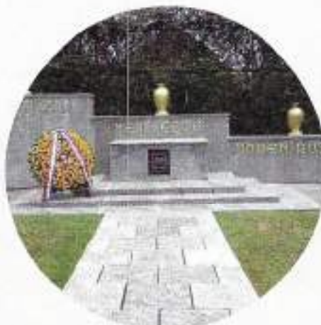
Ereveld Kembang Kuning