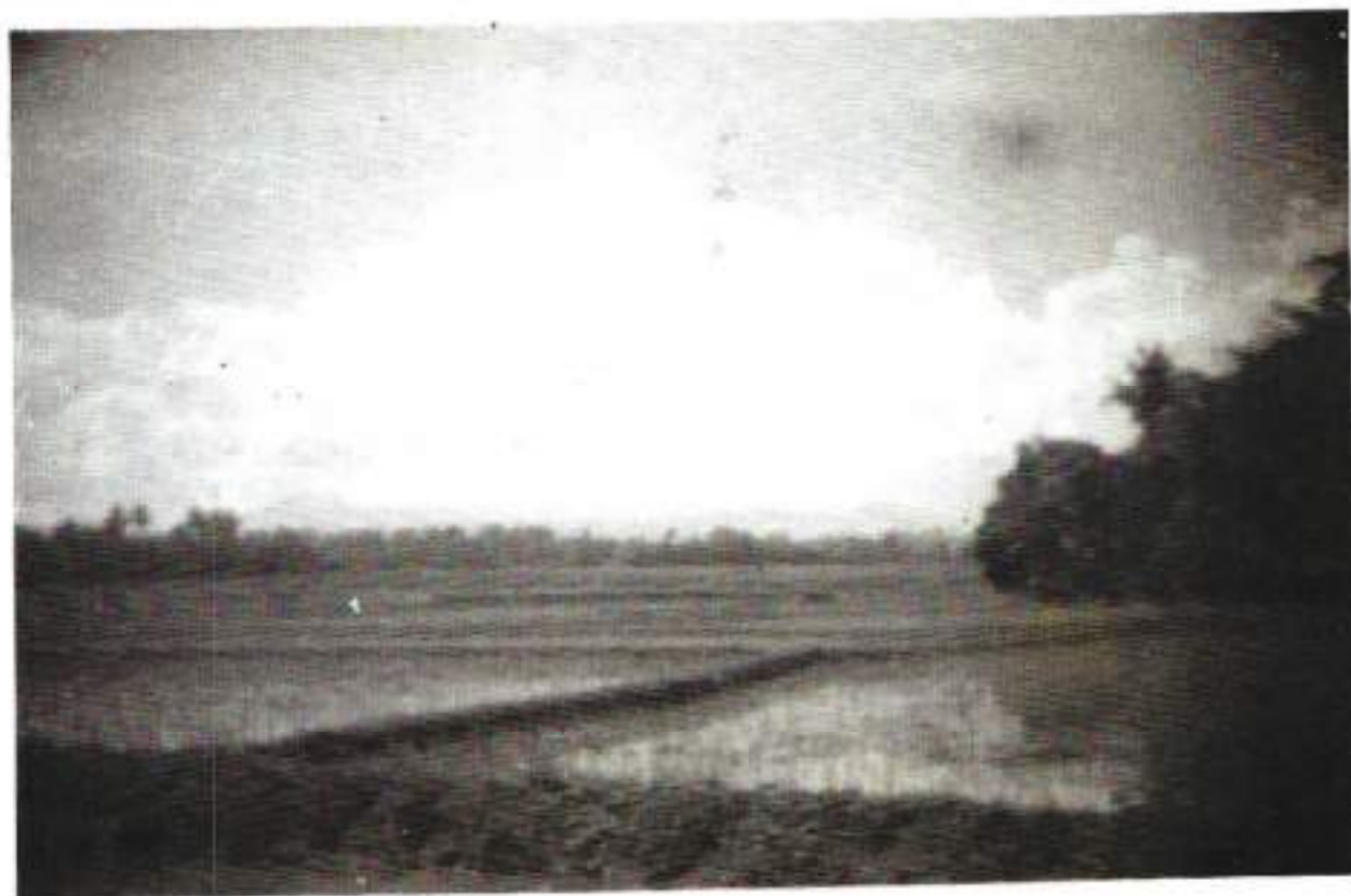
Gezicht op een sawah

Wat ons toch deed beseffen dat we in oorlog waren, waren de vliegtuigen in de lucht. Regelmatig zagen we een bommenwerper overvliegen, begeleid door enkele jagers, op weg naar vijandelijk gebied. Ergens gaf ons dat toch een veilig gevoel. Tegen twee uur in de middag kwamen we in een prachtig berglandschap terecht. Als je niet beter zou weten, zou je je op vakantie wanen. Glinsterende sawahs, groene palmbomen, beboste bergen en hier en daar een stromend riviertje, gaven het geheel een fascinerend aanzicht. Het enige dat er aan ontbrak waren de vrouwen en de meisjes, de mannen en de jongens met hun karbouwen om het land te bewerken. Vanuit onze positie zagen we aan de