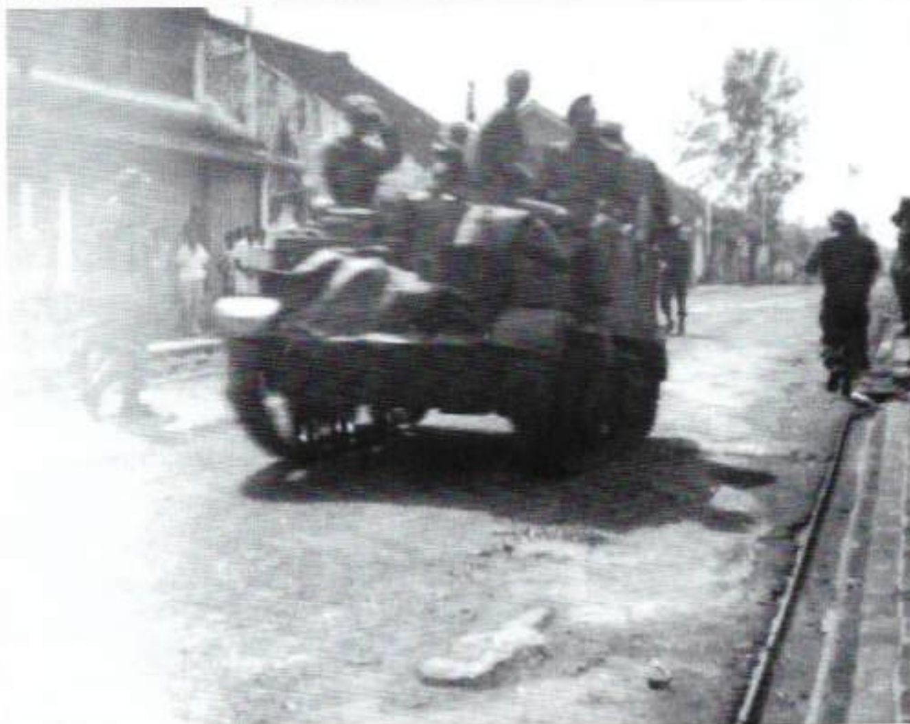
Eén van de carriers in Muntilan

Intussen had men in Muntilan ontdekt, dat er iets goed mis was en zijn er hulpacties gestart. Men ontdekte dat de jeep was beschoten door 2 Vicker-