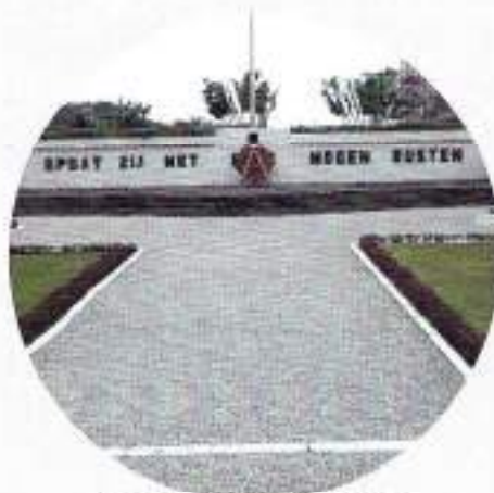
Ereveld Menteng Pulo