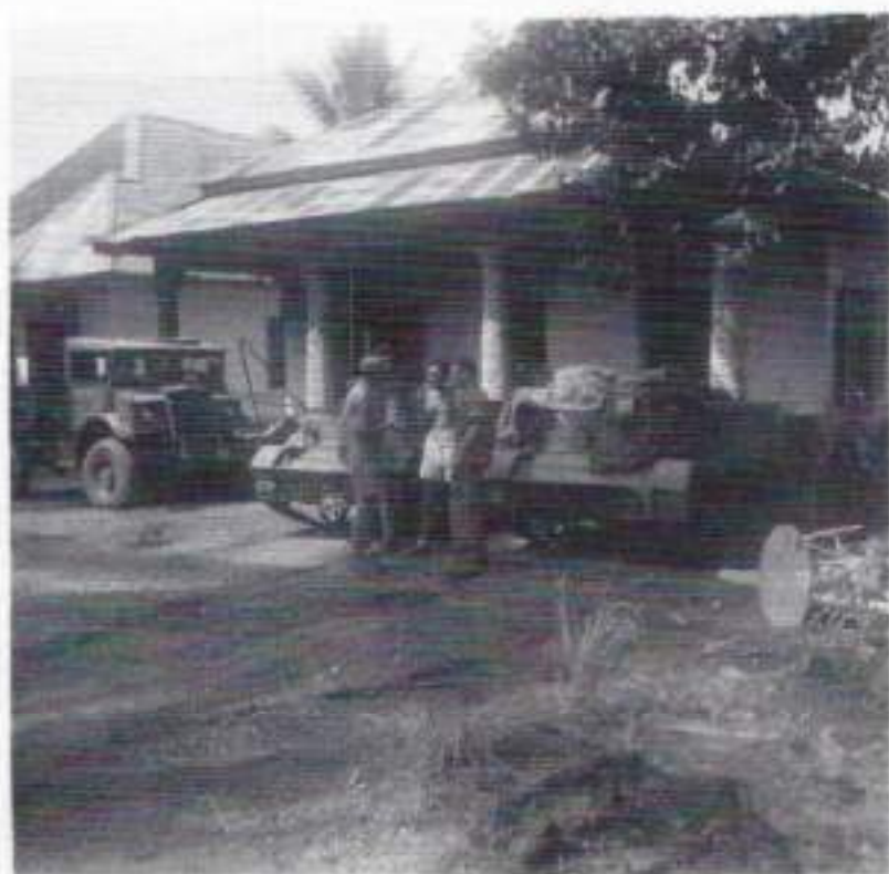
Twee carriers die bij ons waren ingedeeld