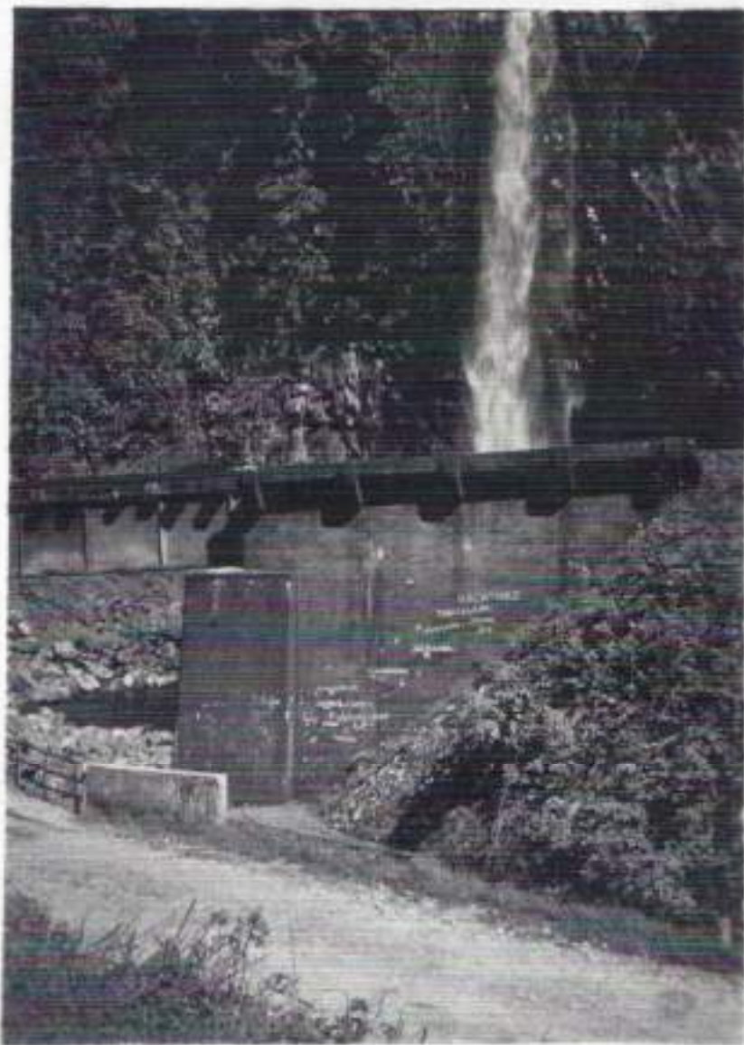
Een waterval in de Anaikloof

drietonner niet was komen opdagen. Wat nu? Besloten werd voorlopig een korte rust te houden en in die tijd na te gaan wat ons te doen stond. De meningen liepen -zoals meestal- nogal uiteen. De meesten van ons wilden het liefst in de kampong overnachten om zodoende weer wat op krachten te komen. Een kleine groep vond het beter zo snel mogelijk te voet de terugweg te aanvaarden. Dat betekende echter wel een afstand van circa 20 kilometer lopen en voor een belangrijk deel in het donker. Terwijl we nog druk stonden te overleggen, hoorden we in de verte het geluid van vrachtwagens. Het waren drie waterwagens, die de jongens aan het front van water hadden voorzien. De