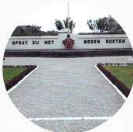
Ereveld Menteng Pulo