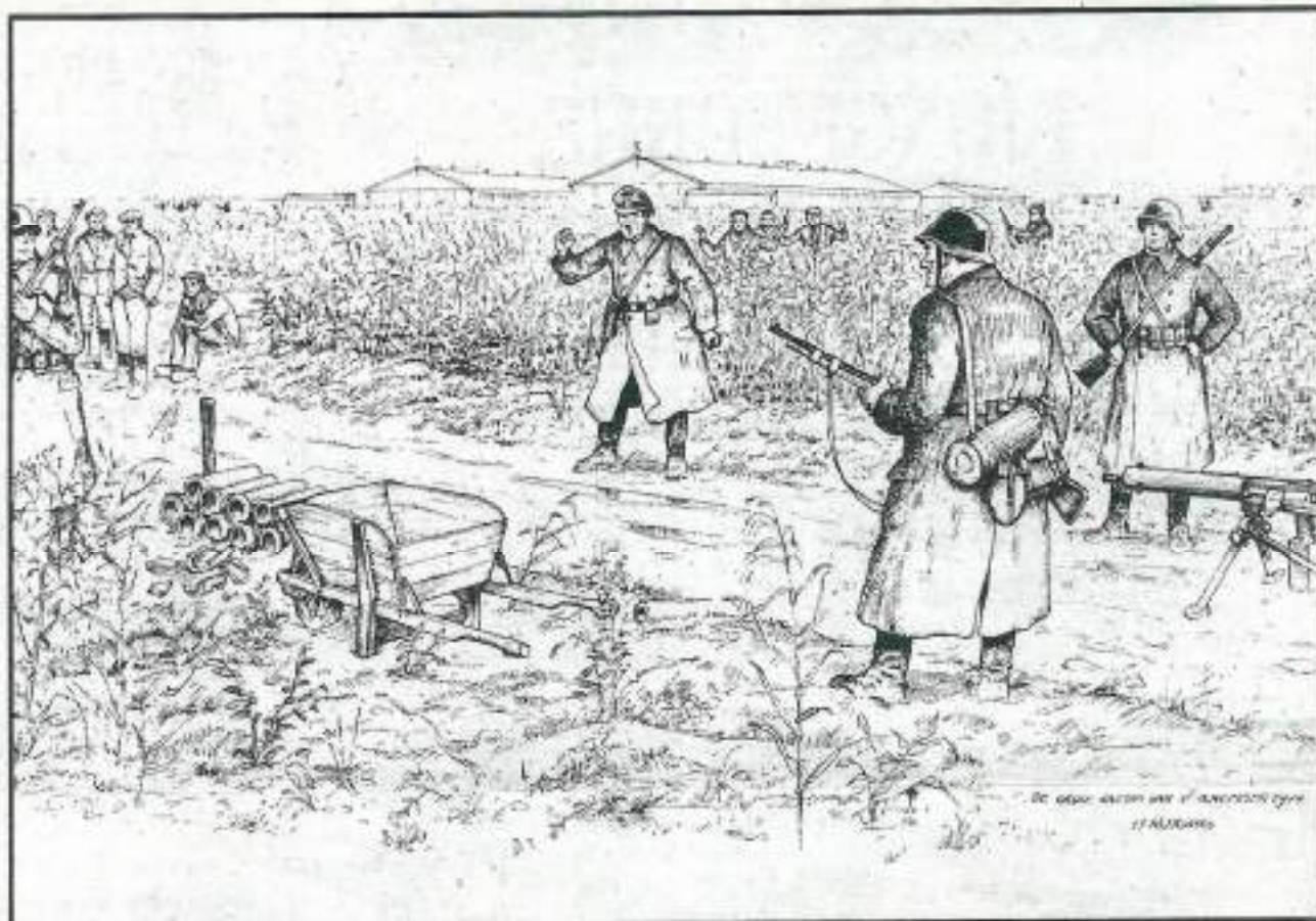
□ De grote razzia op 17 november 1944 in de Noordoostpolder door Henk J. Rotgans in beeld gebracht.

Zo dacht men. Het vliegtuig, een geallieerde bommenwerper op weg naar de stad Bochum, was neergeschoten. Bij 't Veer in Grafhorst staat nog een monument om de mensen te gedenken die voor ons zijn gevallen. Er was één overlevende. De overige bemanningsleden liggen begraven op het kerkhof van Grafhorst.