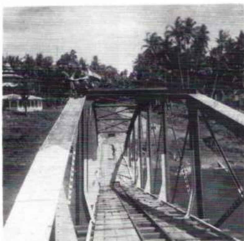
Gezicht op een nieuwe brug

Bij aankomst in Loeboekaleng merkten we al gauw dat de