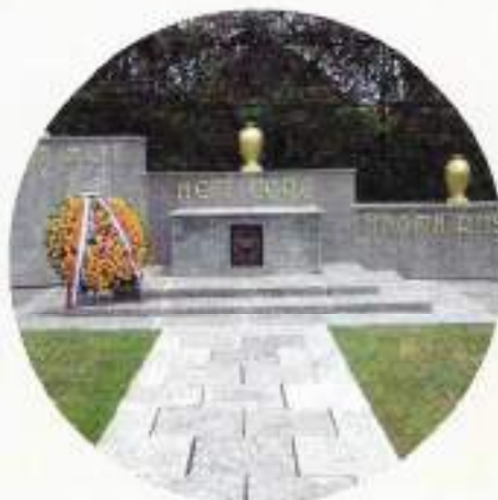
Ereveld Kembang Kuning