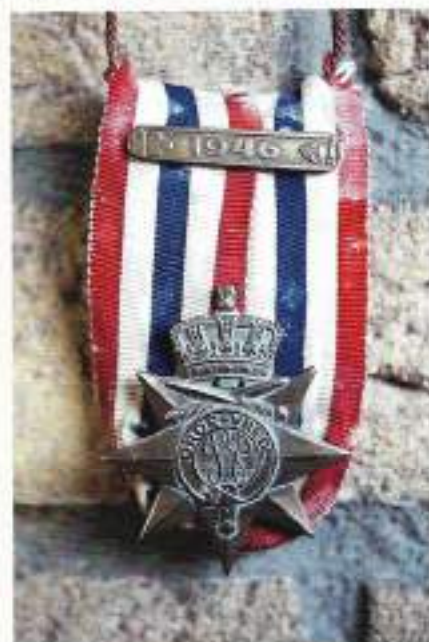
Ereteken voor Orde en Vrede