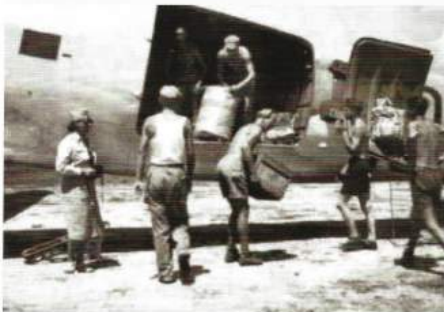
Het lossen van de foerage uit het vliegtuig

Het vliegtuig begon te zwabberen en gleed door om met een vleugel tot stilstand te komen tegen één van onze voertuigen, een 3-tonner.