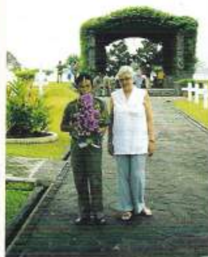
Bezoek aan het graf in 2000

Dré en Akko maakten in het jaar 2000, samen met andere nabestaanden, een door