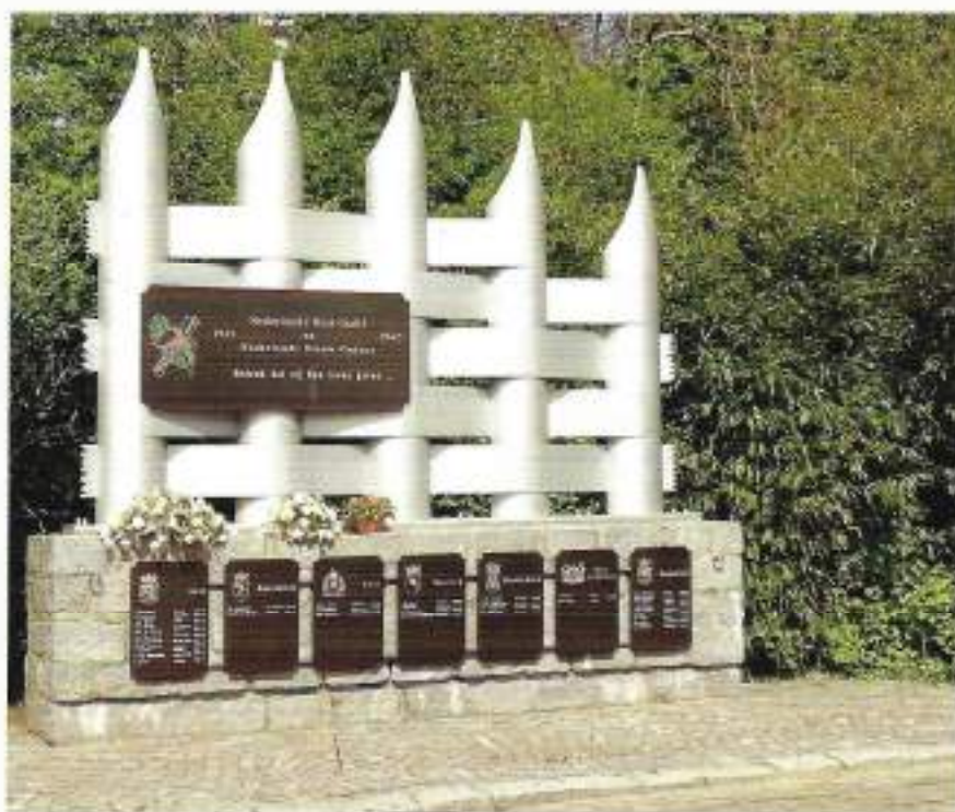
Monument in Terneuzen

Oorlogsslachtoffer, slachtoffer van de oorlog Sinds 30 augustus 1996 is er een Indië-monument in