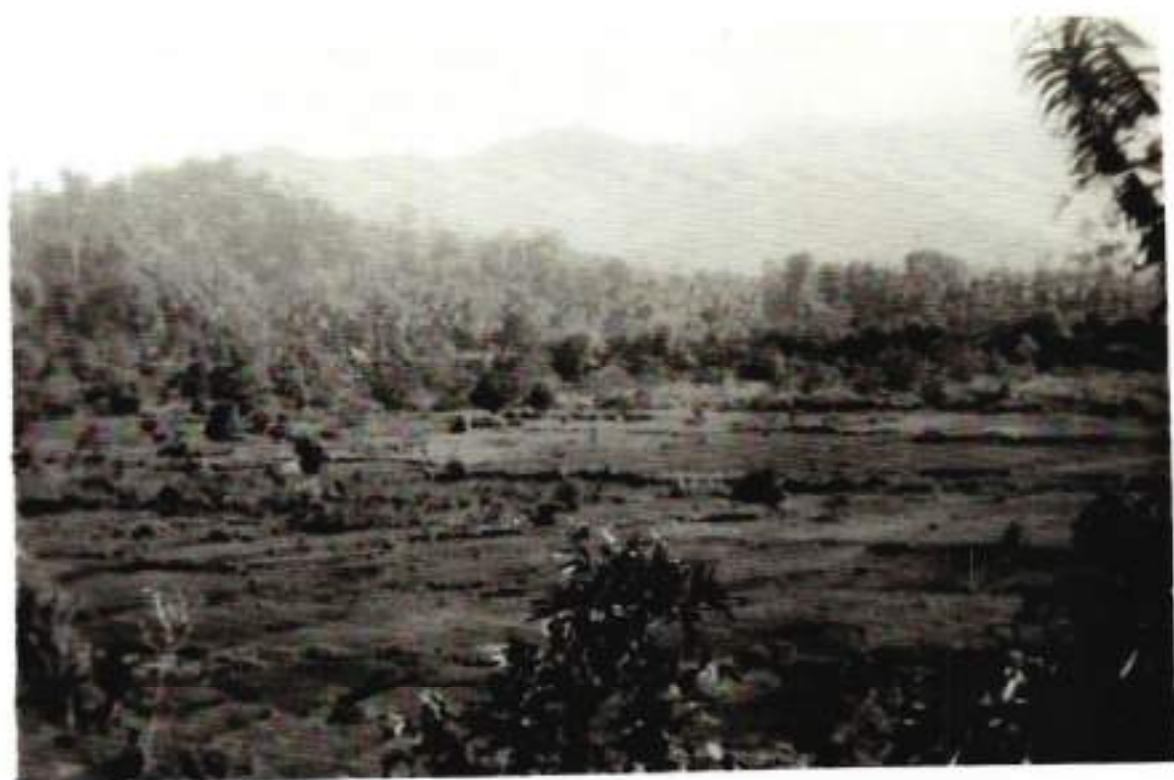
Op de achtergrond het bergterrein nabij Kajoe Tanam (februari 1949)

Op een hoogte van ongeveer vierhonderd meter houdt het struikgewas op en ontdekken we een kleine desa (dorp) bestaande uit hooguit acht huisjes, half verscholen tussen klapperbomen en bamboebosjes. Op het eerste gezicht ziet het er verlaten uit. Geen gebiaf van honden en geen rijst stampende vrouwen, welke geluiden je dikwijls hoort bij het naderen van een desa. Als we wat dichterbij komen, zie ik een al wat oudere man in gehurkte houding voor zijn huisje zitten. Hij schrikt wanneer