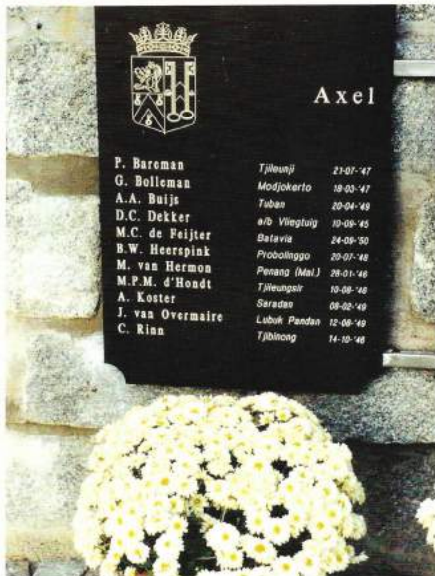
Plaquette op het monument

Het monument in Terneuzen stelt een besleng voor, een omheining van bamboe waarmee in Nederlands-Indië kampongs en legerkampen werden afgeschermd tegen gevaar. Waar je waarde aan hecht, wil je immers beschermen. Het zogenaamde vlechtwerk van de besleng is wit, de kleur van de onschuld en van vrede. Een ode aan jongens die het leven lieten voor een ideaal: Orde en Vrede brengen in een verscheurd land.