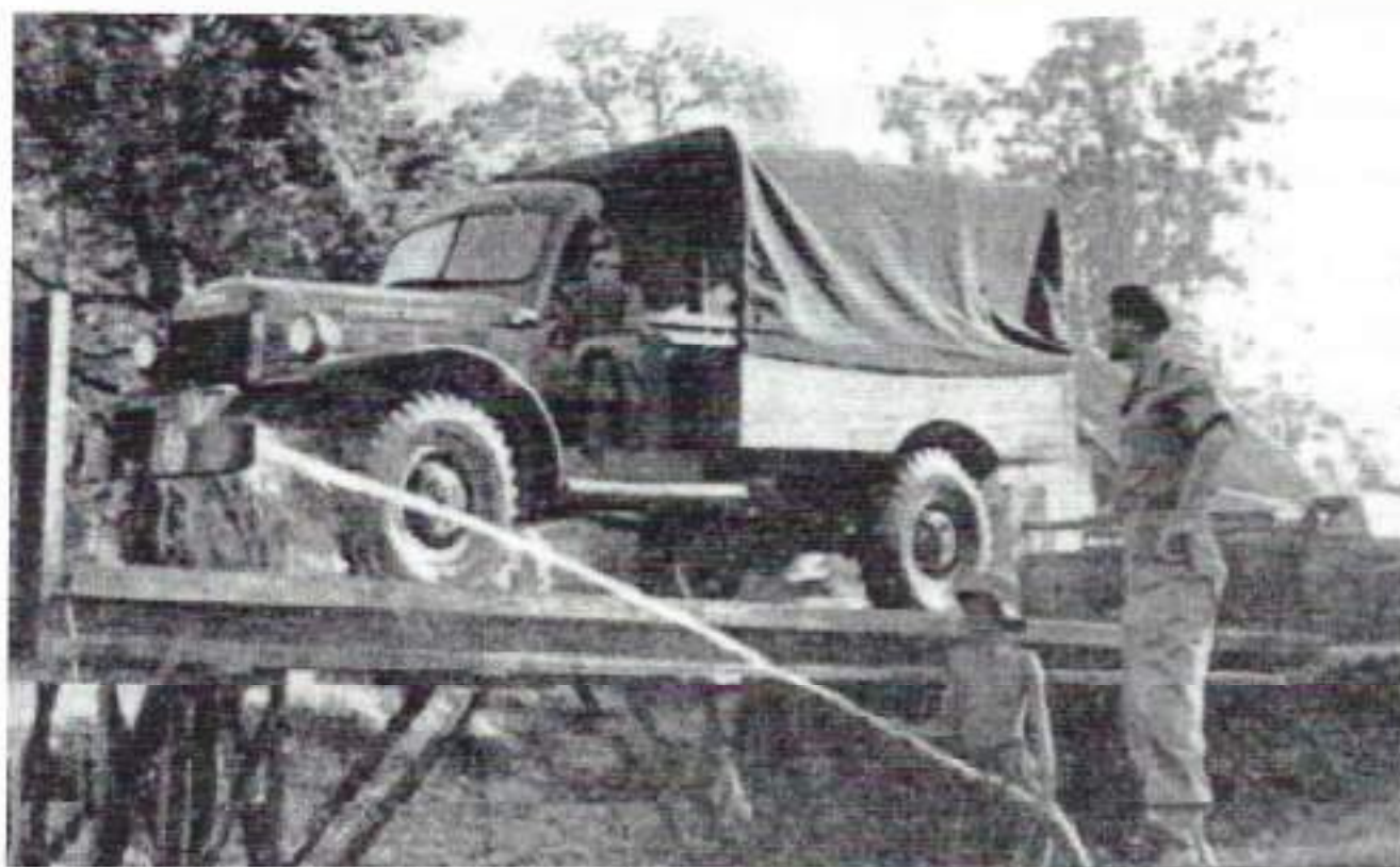
Grote schoonmaak was een vereiste vóór de inspectie