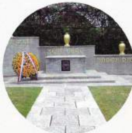
Ereveld Kembang Kuning