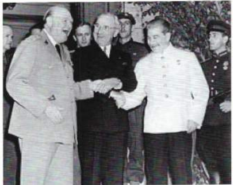
Conferentie van Potsdam (v.l.n.r. Winston Churchill, Harry S. Truman en Jozef Stalin)

Nu de oorlog voorbij was, wilden de UK militairen zo snel mogelijk naar huis in plaats van nog geruime tijd nablijven voor nieuwe taken. Met operatie Python werd de