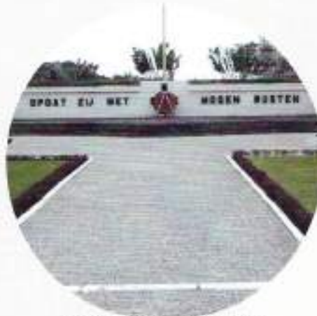
Ereveld Menteng Pulo