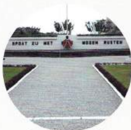
Ereveld Menteng Pulo