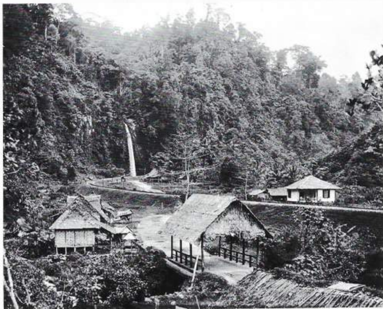
Anakloof bij de Analrivier

patrouille door een onbewoond gebied, waar geen paden zijn maar wel veel obstakels, een zeer riskante onderneming. In gedachte doe ik zo nu en dan een schietgebedje en smeeke Onze Lieve Heer ons te begeleiden en veilig terug te brengen. Opeens horen we in de verte het geluid van stromend water. Als door een wonder breekt tegelijkertijd het schemerdichte bos open en komen we op een open plek waar we eindelijk de zon weer zien en een prachtig uitzicht hebben op een dal. De dalwanden lopen op tal van plaatsen bijna loodrecht naar beneden. Overgoten door de