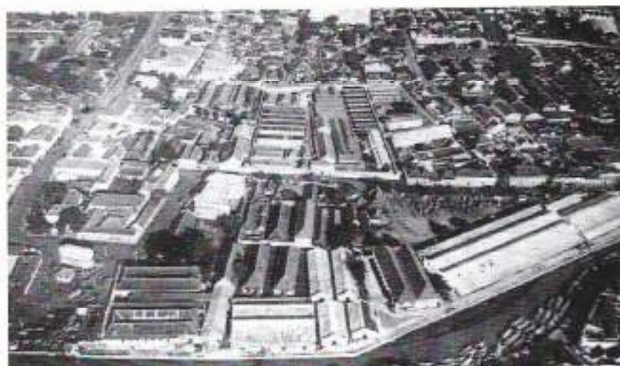
De Werfstraat met de gevangenis

Behalve voor het organieke werk dat door de 42 AAT'ers werd verricht in de functie waarvoor ze waren opgeleid of waren ingedeeld, werd er vaak ook een beroep op hen gedaan voor het verrichten van andere diensten ten behoeve van het eigen onderdeel of van het garnizoen waartoe het onderdeel behoorde. Daarbij namen de wachtdiensten bij verschillende objecten een belangrijke en steeds weer terugkerende plaats in. Naast de bewaking van de eigen kazerne leverde onze compagnie geregeld personeel voor onder meer het wachtlopen bij de Wonokrombrug aan de zuidkant van Soerabaja en de gevangenis in de Werfstraat. Maar ook bij gelegenheden of gebeurtenissen waarbij een defilé werd gehouden, was 42 AAT meermalen van de partij.