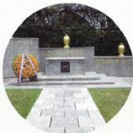
Ereveld Kembang Kuning