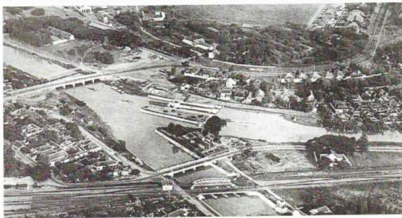
Het Wonokromcomplex met links de brug in de uitvalsweg richting Malang

organieke taak, bevoorrading van de troepen, in praktijk te brengen. Daarin kwam op 2 april verandering. Ik kreeg de opdracht me met ruim de helft van het peloton naar Madioen te begeven om bij de al bestaande aanvullingsplaats