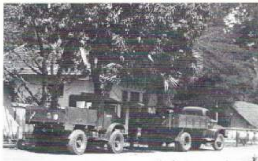
Ons wagenpark, links de driekwart tonner en rechts de drie tonner. Op de achtergrond een van de drie woningen (onze behuizing)

Aan het eind van een lange rechte straat komen we bij een grote loods waarbij we bedrijvigheid van militaire trucks en luchtig geklede blanke en inlandse mensen zien. We zijn aan het goede adres. De straat maakt voor het gebouw een ruime bocht naar rechts en gaat dan over in een smallere straat die in een kampong verdwijnt. Naar links loopt een straat evenwijdig aan een