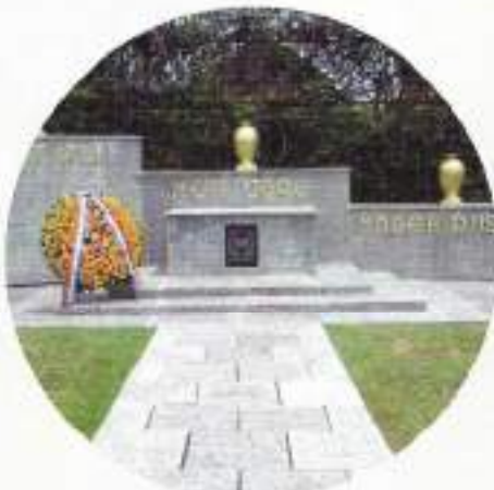
Ereveld Kembang Kuning