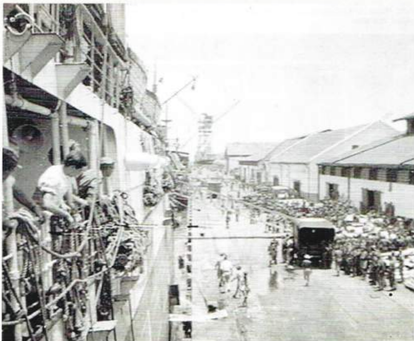
Ontscheping, oktober 1946 in Soerabaja

Na Sumatra ging de reis verder naar Soerabaja op Java.