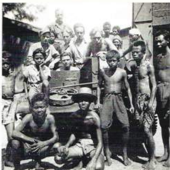
Tussen de inlanders, december 1946