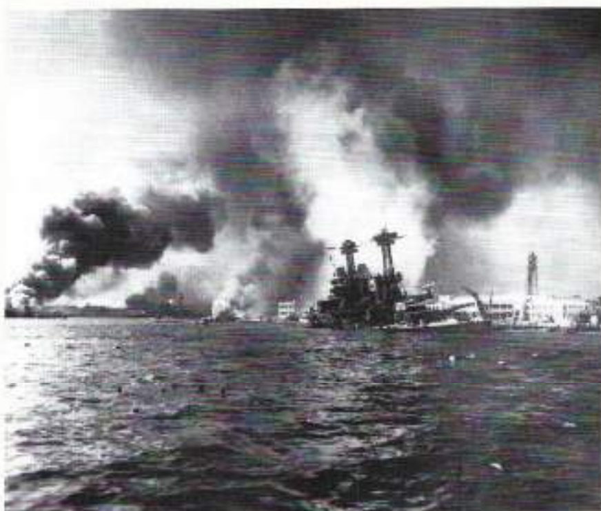
Japanse aanval op Pearl Harbor (7 december 1941)