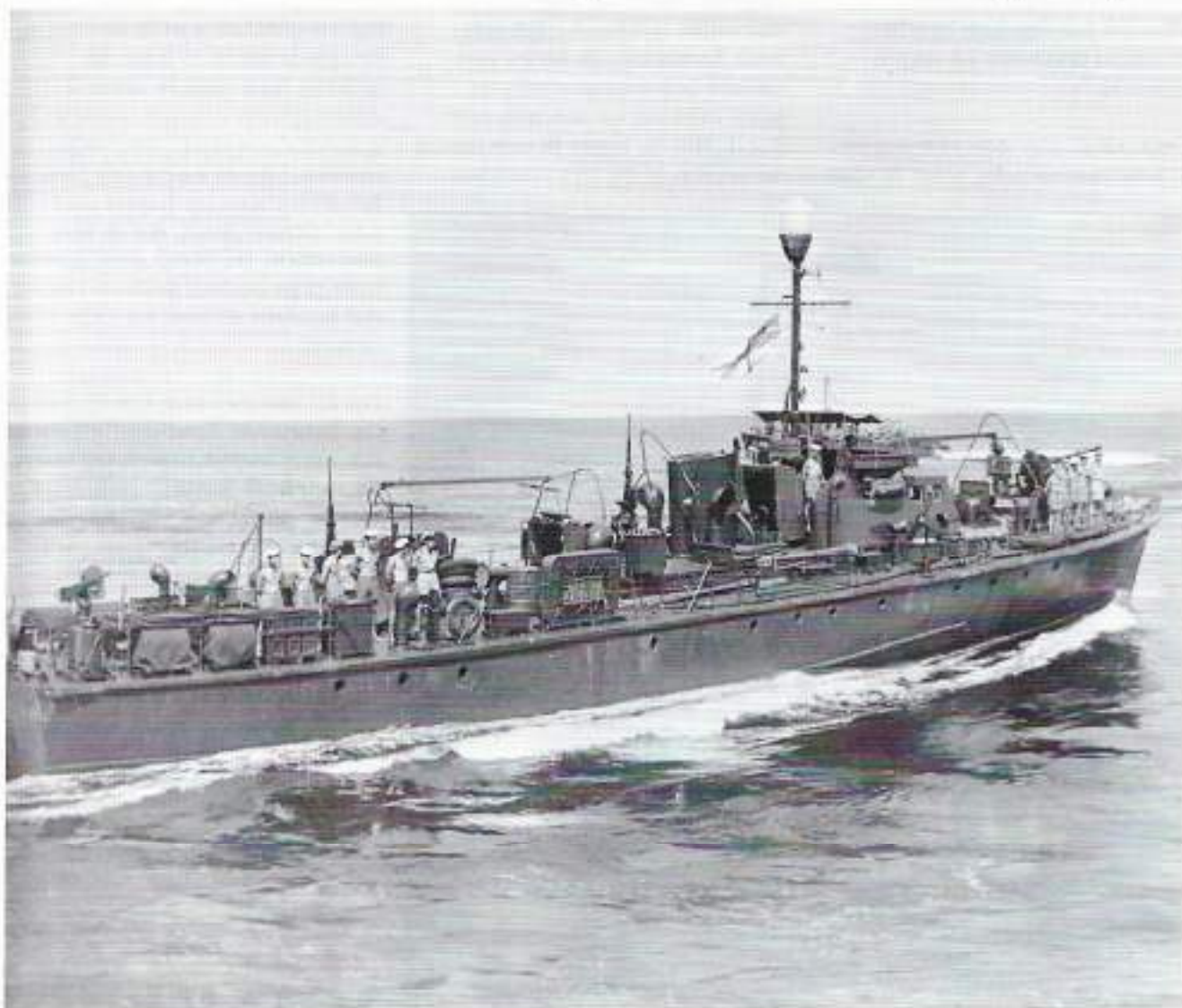
Het schip op de foto is vergelijkbaar met de KOALAS. De KOALAS was wel 12 meter langer.

Het was 08.15 uur maar het feest was nog niet afgelopen, want er volgde nog een geheel andere verrassing. Ik kreeg