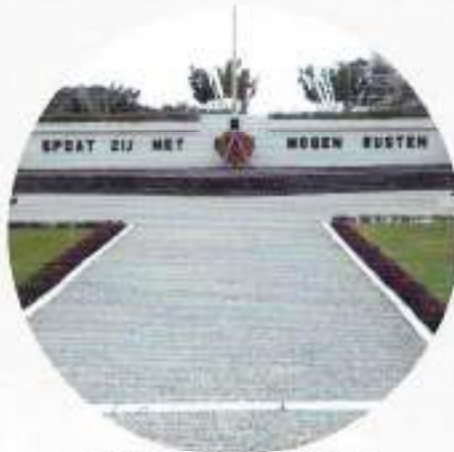
Ereveld Menteng Pulo