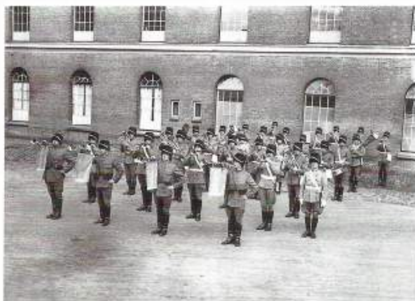
Trompetterkorps Huzaren van Boreel

deden we zonder wapen, maar toen we eenmaal een wapen hadden, werden we de eerste zes weken flink bezig gehouden met geweroefeningen. Enkel en alleen om de discipline er in te hameren. De jongens die toen wegliepen tijdens de exercitie zijn verwijderd uit het peloton en we hebben ze nooit meer terug gezien. Na de eerste zes weken gingen we het veld in en werd de verstandhouding met het kader ook een stuk beter. Ik ging om de veertien dagen met lang weekend, de andere weken was je pas op zaterdagmiddag om 16.00 uur thuis en moest je op zondagavond al weer terug en had je ook geen vrij vervoer. Een treinkaartje kostte 3 gulden en 25 cent enkele reis. Nu was het niet zo dat ik dat niet kon betalen, maar ik vond het niet nodig om elke week naar huis te gaan. Als de meeste jongens dan om 12.00 uur naar huis gingen, dan zaten de achterblijvers (waaronder ik) zich te goed te doen aan de erwtensoep of hachee met veel vlees er in.