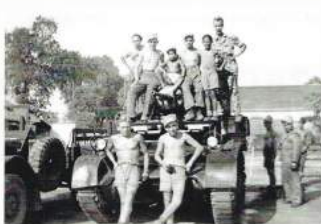
Met maten bij de werkplaats in Malang