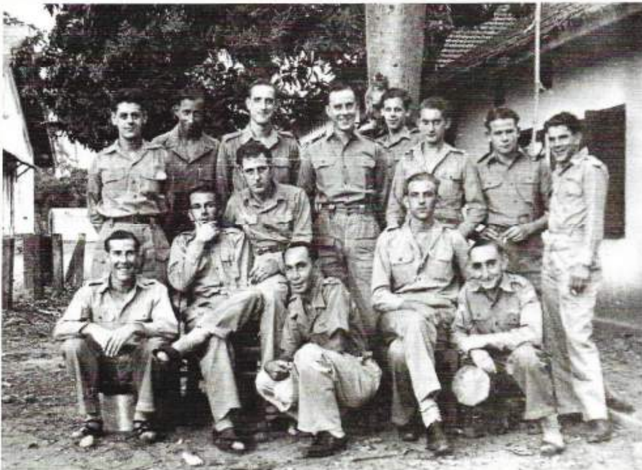
De groep 'Madloen' op z'n zondags. Bij het werk werd luchtiger kleding gedragen

Van de plannen die onze legerleiding met ons had, waren we eigenlijk maar matig op de hoogte en van de politieke touwtrekkerij tussen Nederland en Soekarno met zijn trawanten werd ons ook niet veel verteld. De troepen van het KNIL en de KL moesten verzorgd worden en daar zouden we nog wel een tijdje mee bezig zijn. Tot wanneer was onbekend.