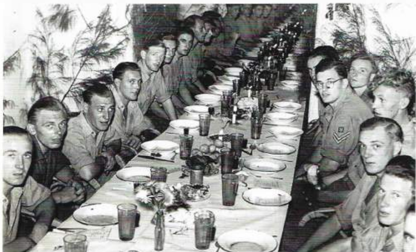
Kerstmaaltijd, december 1946 in Soerabaja