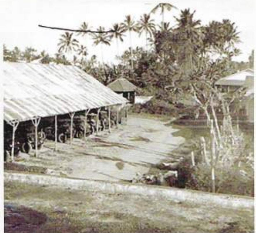
De werkplaats in Batoe