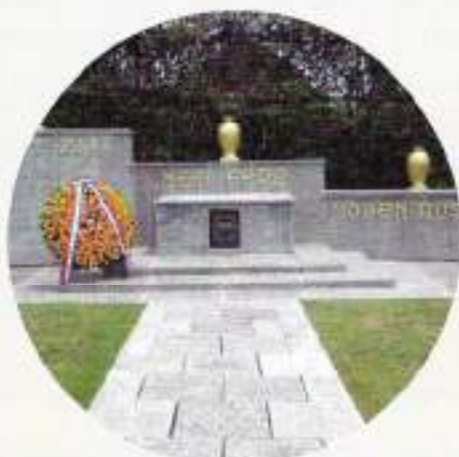
Ereveld Kembang Kuning