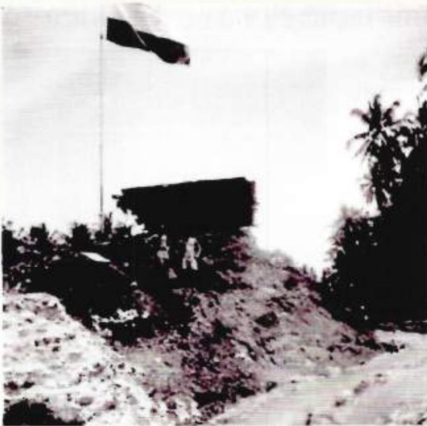
De vlag in top op onze stelling in Koeraitadji

de terugweg, met een deel van de D-compagnie, was het weer raak. Soldaat Dol had alle geluk van de wereld toen hij bij zwaar vuurcontact achter de wielen van een truck was gedoken en de band van het voertuig werd geraakt.....en niet hij. Hevig geschrokken van de klapband die de kogel had veroorzaakt, kon hij later opgelucht verder gaan.