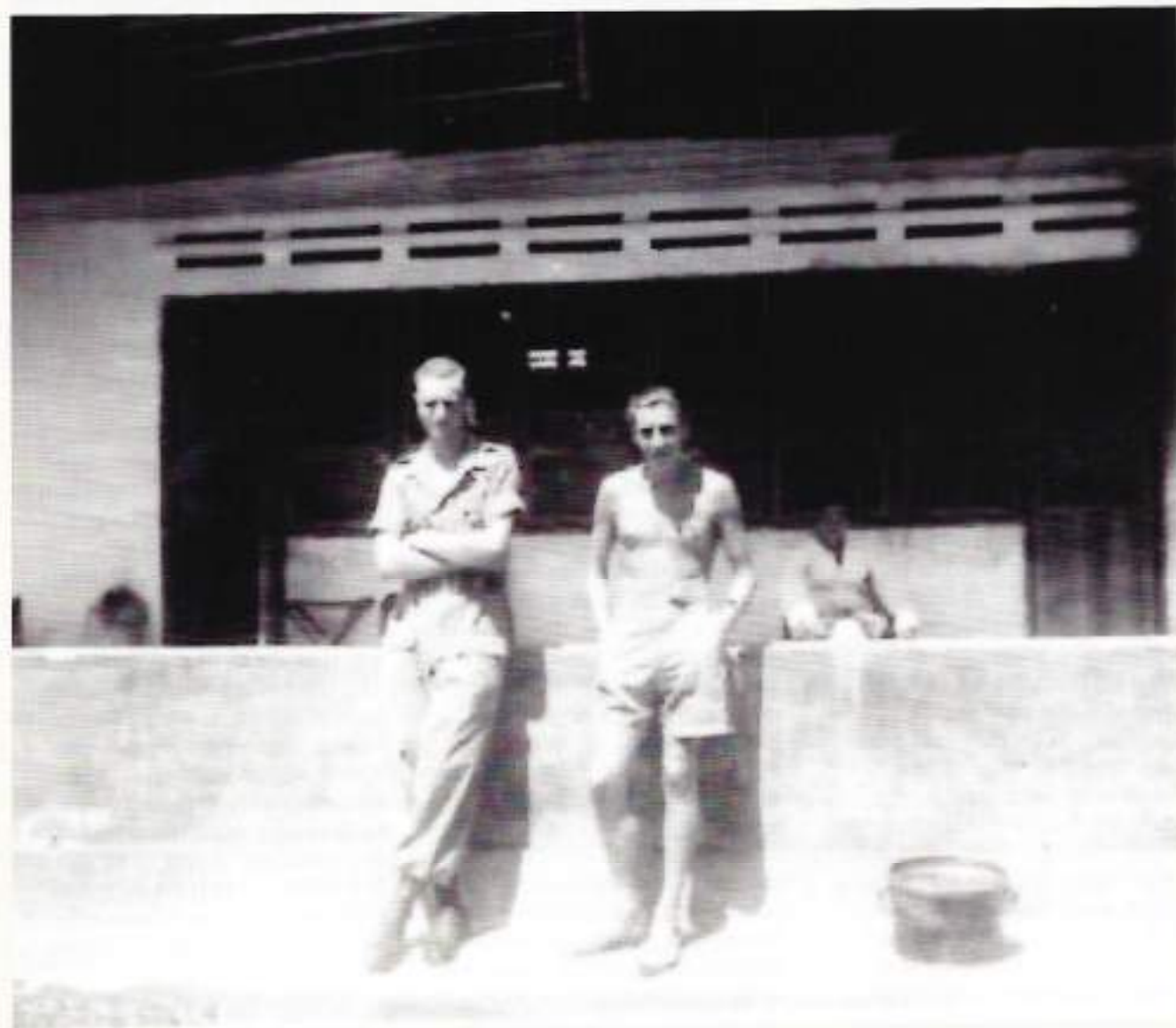
Voorraanzicht van ons huis in Koeraltadji

Ook ondervonden ze nogal vertraging door wegversperringen en vernielde bruggen. Eerst tegen het vallen van de avond bereikten zij Pariaman. Ook op