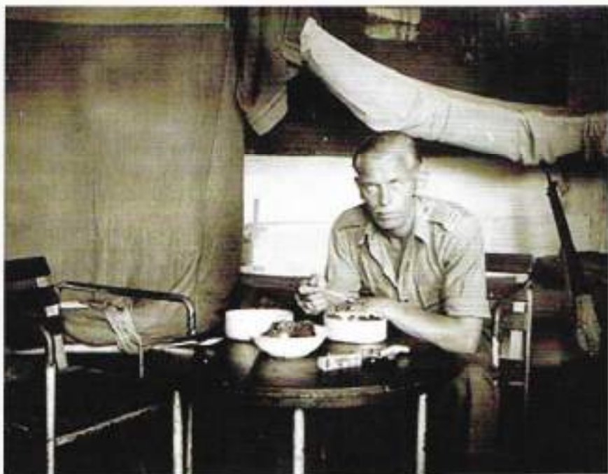
Eten en rusten in Batoe.