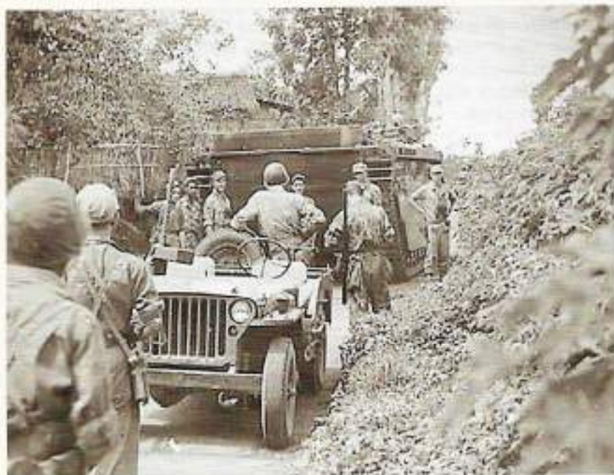
1e Politionele Actie

Het wachtlopen hier was ook totaal anders dan in