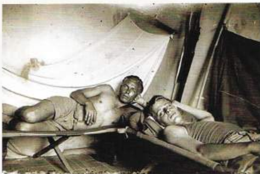
Boven het hoofd de klamboe om 's nachts de muggen weg te houden.