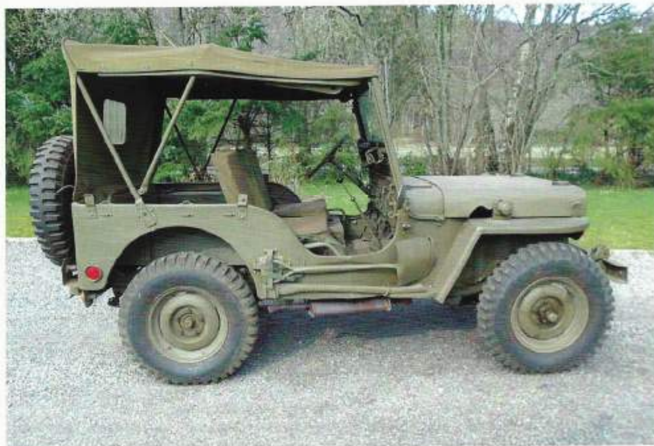
Willys M38 Jeep

Het pad naar de woning kronkelde als een roodbruin lint tussen strak onderhouden