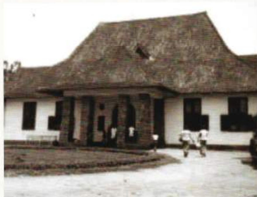
De hoofdingang van het Zendingshospitaal

De middag van 30 oktober ging ik met ds. Schut naar Gondang Winangun, de grootste