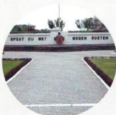
Ereveld Menteng Pulo