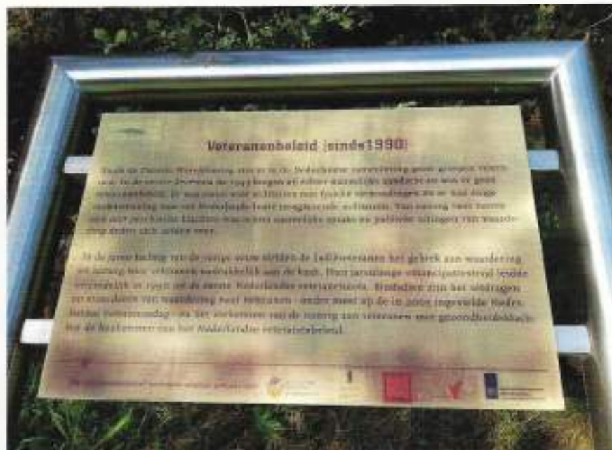
Informatiepaneel over het Veteranenbeleid langs het Veteranenwandelpad

De idee om een landgoed/bosgebied als groen eerbetoon aan de Nederlandse militaire veteraan te stichten is ontstaan in de tijd dat er steeds meer aandacht kwam voor "veteranen", met name voor de