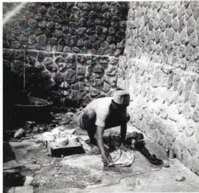
De was wordt gedaan door een inlandse jongen