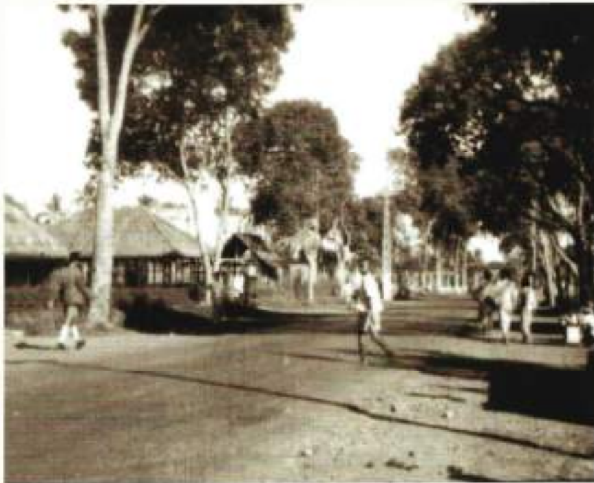
De verbindingsweg tussen Semarang en Salatiga voor ons huis in Ungaran