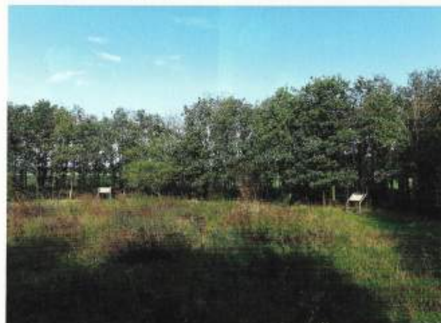
Een impressie van de Cirkel van Nederlands-Indië in noordelijke richting

grote mate hebben bijgedragen aan de gerechtvaardigde wens om als veteraan “gehoord en gezien” te worden: aan deze wens is gehoor gegeven, want het veteranenbeleid is er inderdaad gekomen! Ook op het Veteranenlandgoed “Vrijland” wordt aan de verrichtingen in Nederlands-Indië, in het latere Indonesië en in Nieuw-Guinea ruim aandacht besteed. Daarmee blijft dit gedeelte van de Nederlandse militaire historie voor hen die na ons komen leven in de herinnering!