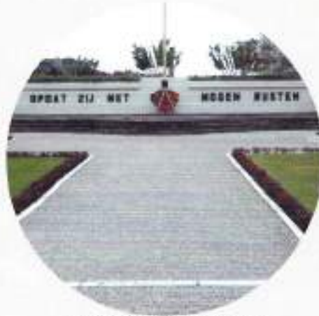
Ereveld Menteng Pulo