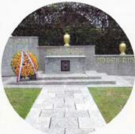
Ereveld Kembang Kuning