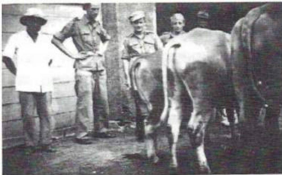
Koelen voor Madioen klaar voor transport

Iedere dag werden in een slachthuis voor het leger twintig runderen geslacht en op vrijdag veertig stuks. Dat waren geen karbouwen maar zogeheten Javaanse sapi's (Sapi Djawa). Om half tien 's morgens ging ik met de chauffeur naar het slachthuis