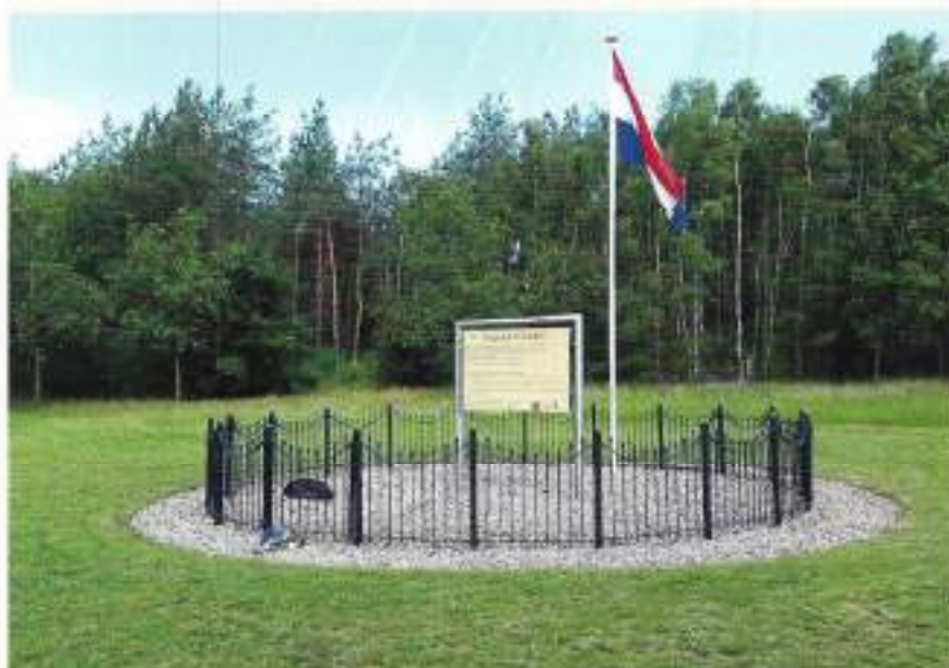
Het Plein van de Grondwet op Veteranendag 2020

met nadruk opgeroepen om hun problemen te onderkennen - en met succes. Daarbij zijn het vooral mensen uit de gelederen van uw vereniging, VOMI, geweest die zich hiervoor hebben ingezet. Daarvoor moeten wij als samenleving U dankbaar zijn! Op één van de informatieborden langs het Veteranenwandelpad wordt aandacht besteed aan het van de grond komen van het Veteranenbeleid.