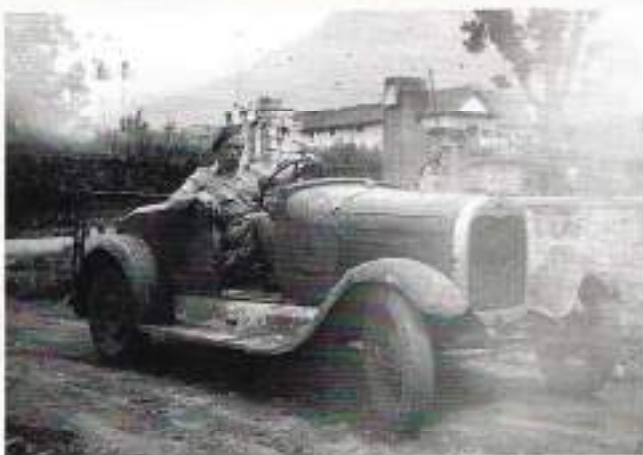
Jan en zijn maat vermaken zich in de bergen bij Batoe met een oude Ford