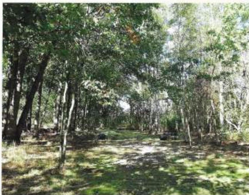
Een nazomers zicht op het Verstrooiveld

wal van organisch materiaal die als het ware bescherming biedt aan hen die daar verstrooid zijn. Veel veteranen van het eerste uur zijn aan deze grond toevertrouwd. Op de website