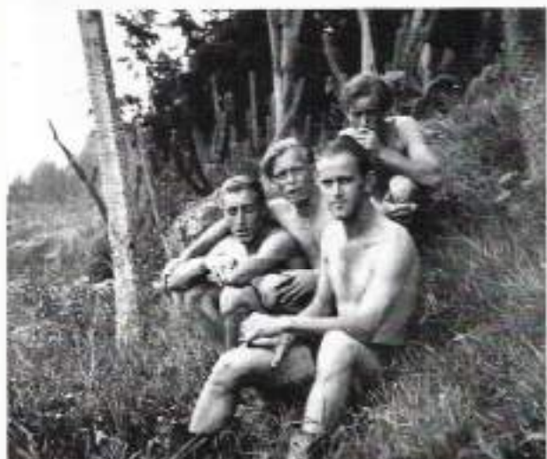
Juni 1948 in de bergen (Selecta) bij Batoe