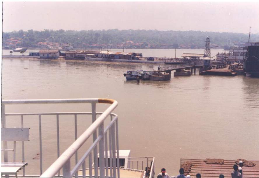
Haven van Kamal met aanlegsteiger (tijdens ons bezoek in april 1999)

Hij stond in deze periode tussen twee vuren: het belang van Madoera en de Madoerezen behartigen en tegelijk het vertrouwen van de nieuwe machthebbers van de Republiek Indonesië winnen. Na het nodige overleg tussen vader en de wali negara enerzijds en vader en de KNIL leiding in Soerabaja anderzijds, werden twee Madoerese luitenants voorbereid op een benoeming en promotie: eerst tot kapitein en later tot overste en majoor. In goed overleg werden de commandanten van de vijf compagnieën aangewezen, alleen de eerste compagnie had een plaatsvervangend commandant.