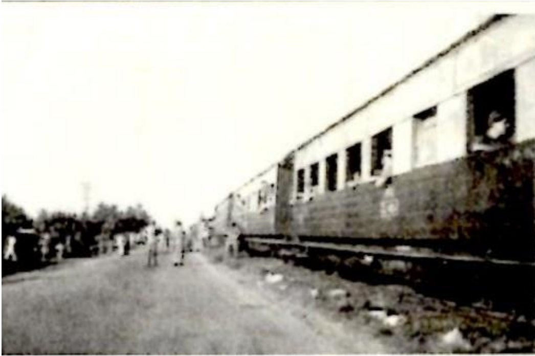
Onderweg even de benen strekken

Het vertrek van de compagnie uit Oost-Java betekende voor mij overigens niet dat ik tegelijk met 42 AAT uit Oost-Java zou vertrekken. Het werk bij de Territoriale Staf Oost-Java zou mij nog enige tijd vasthouden. Maar wanneer 42 AAT naar Nederland vertrekt, zal ik vrijwel gelijktijdig (hetzij met de compagnie of op eigen gelegenheid) repatriëren. Enkele dagen voordat de compagnie uit Soerabaja vertrok, heb ik dus afscheid genomen van de collega's en de compagnie en hen later bij hun vertrek vanaf het spoorperron uitgezwaaid. Ik was als enige 42 AAT'er nog over in Oost-Java.