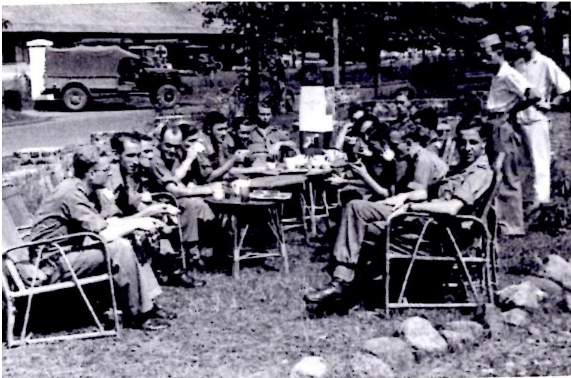
Onderofficieren in OO-mess tegenover de Gubengkazerne

Het werk op het kantoor Verpleging is een staffunctie met regelmatige werktijden overdag. Hoewel er door de constante troepenbewegingen en de daarbij aan te passen bevoorrading genoeg werk aan de winkel is, vind ik het al gauw een wat te rustig baantje. Ik mis het dynamische werk bij de aanvullingsplaats en de omgang daar met de mensen en de troep(en). Na verloop van tijd krijg ik ook de taak om een officier van de TNI wegwijs te maken in het verzorgingswerk. Het is een aardige, vriendelijke en beschaafde eerste-luitenant, die uitstekend Nederlands spreekt. Een van onze werkzaamheden is het doorworstelen van overdrachtsformulieren waarop voertuigen en ander materieel aan de TNI zijn vermeld. Ze waren -als ik me mij goed herinner- opgemaakt in achtvoud en werden daarna door ons beiden van een akkoordverklaring voorzien. Aan de hand van de formulieren zou later een verrekening tussen de Nederlandse en de Indonesische regeringen plaatsvinden voor de overgedragen waarden. Ik ben er nooit achter gekomen wat daarvan terecht is gekomen.