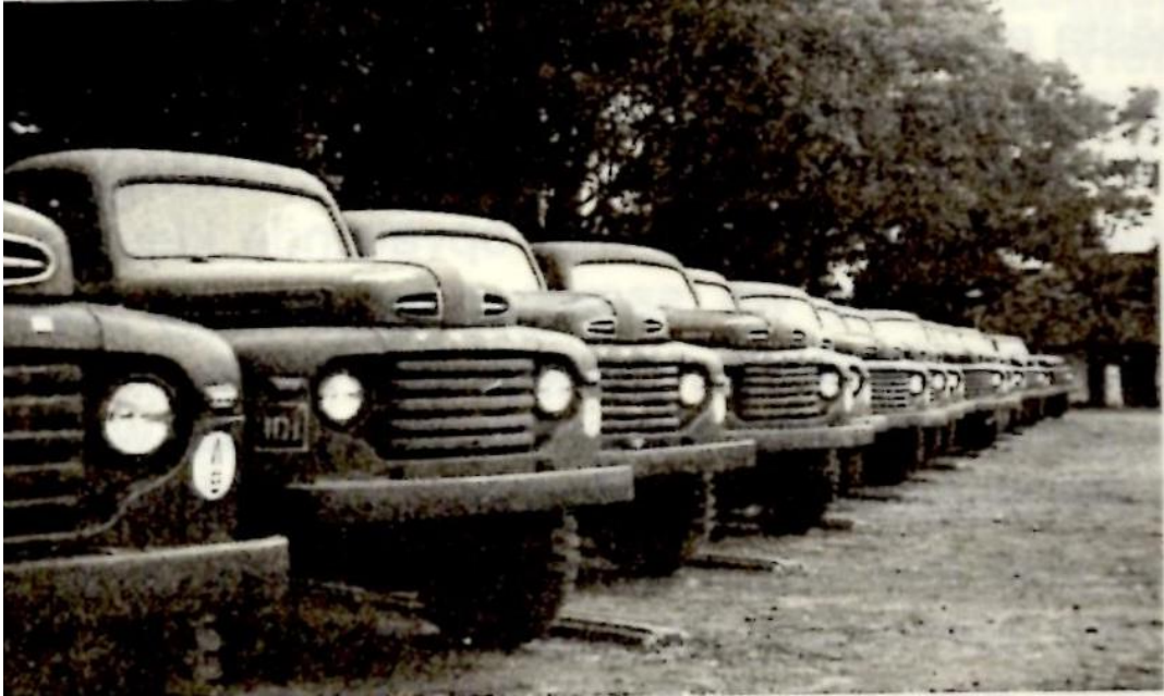
In Batavia kreeg de compagnie weer een wagenpark