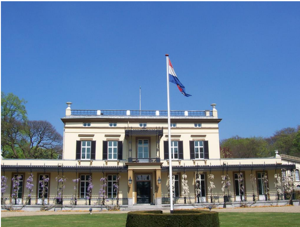
Bronbeek (hoofdgebouw), bakermat van de VOMI