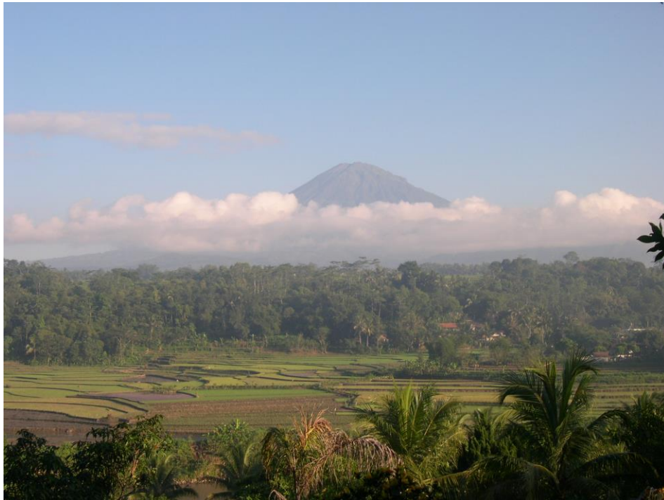
Landschap omg. Magelang

Onderweg naar de verschillende bezienswaardigheden, genoten wij van de overweldigende natuur en de adembenemende landschappen. De foto's tonen maar een fractie van al het moois dat Java te bieden heeft. Een selectie: