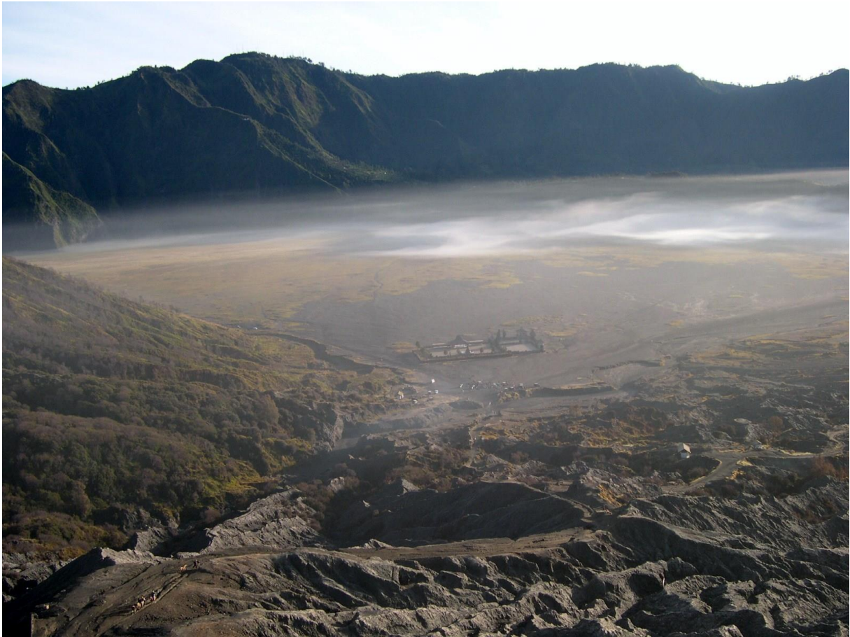
de vulkaan Bromo (Oost Java).

Er moest onderweg uiteraard ook worden gegeten en gedronken ! Niet alleen in restaurants maar ook fruit en lekkernijen gekocht op een passar