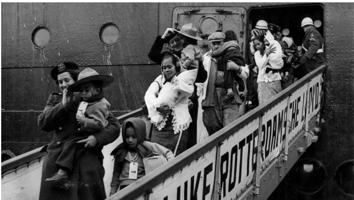
Aankomst Molukkers in 1951 per boot in Rotterdam

Ongeveer 2200 Molukse militairen bevonden zich op het moment van de overdracht op 27 december 1949 -en later- op Ambon. Zij vochten in 1950 voor een onafhankelijke Molukken, de Republiek Maluku Selatan (RMS). Nog eens 3500 KNIL'ers zaten in de kazernes op Java.