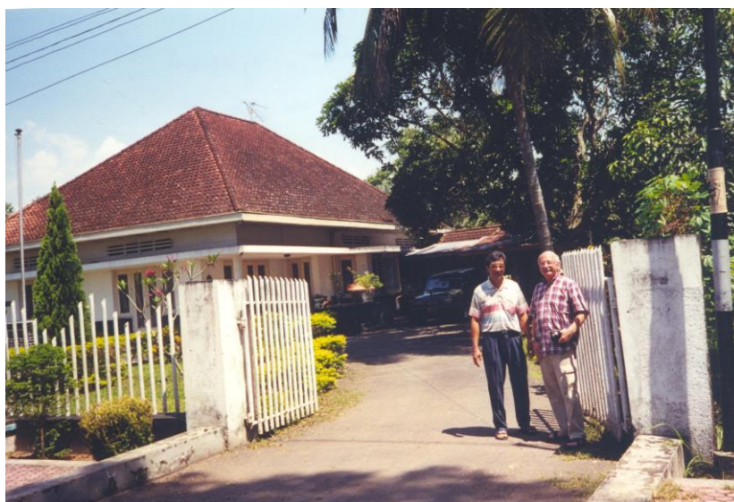
Huidige en 'oude' bewoner van het huis (tijdens ons bezoek in april 1999)