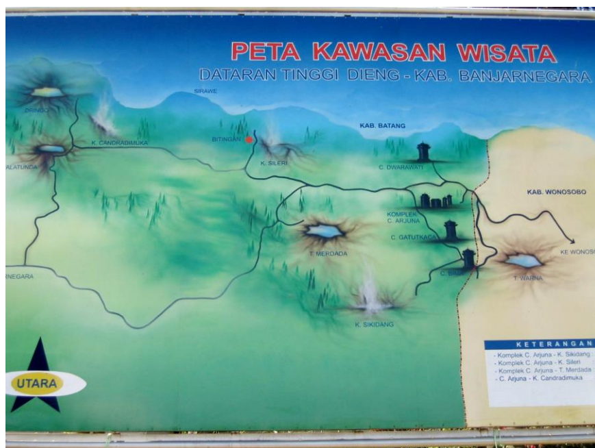
Dieng plateau omg. Wonosobo (1)