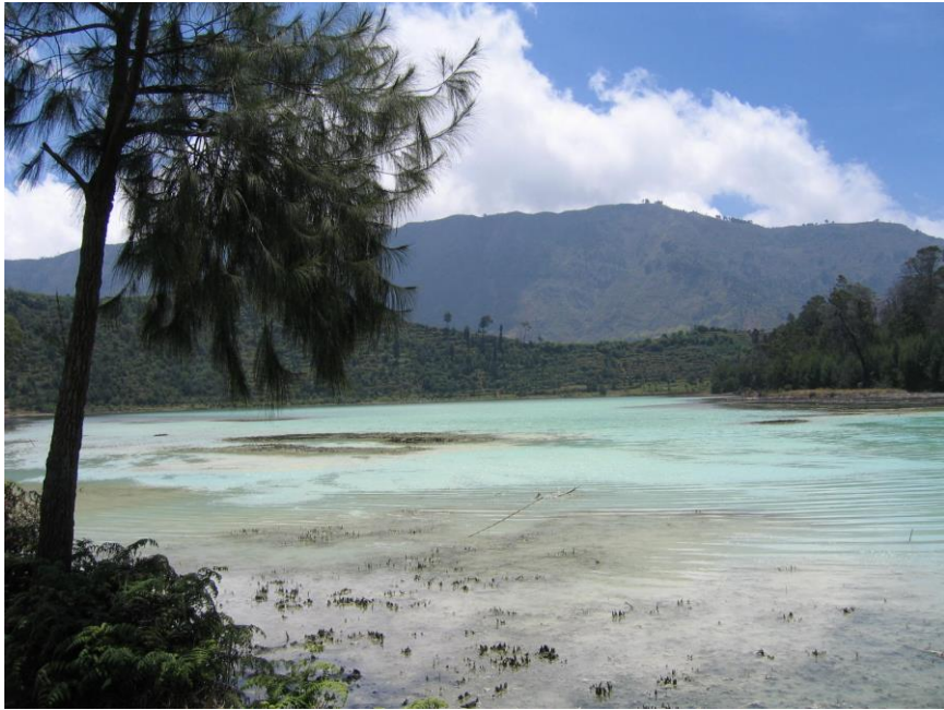
Dieng plateau omg. Wonosobo (2)