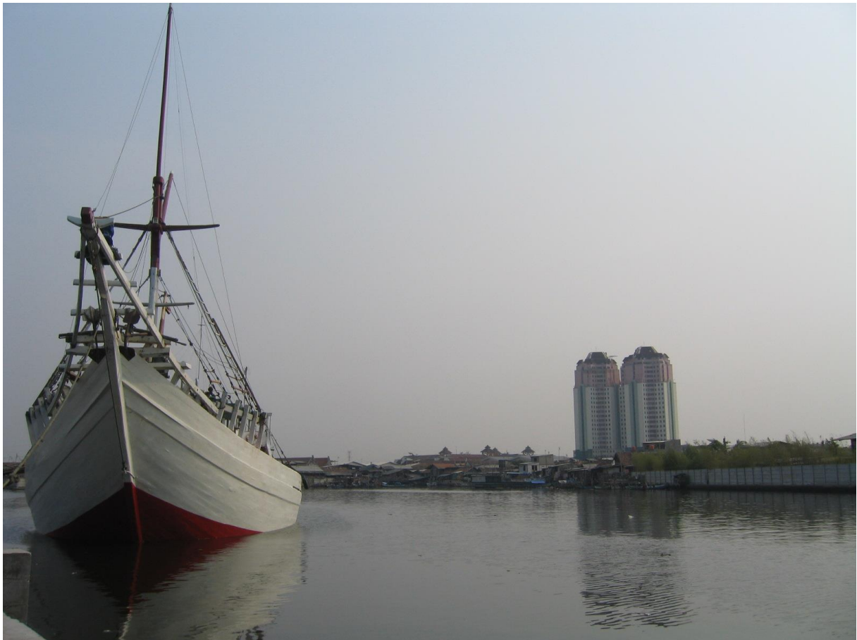
de haven van Surabaya