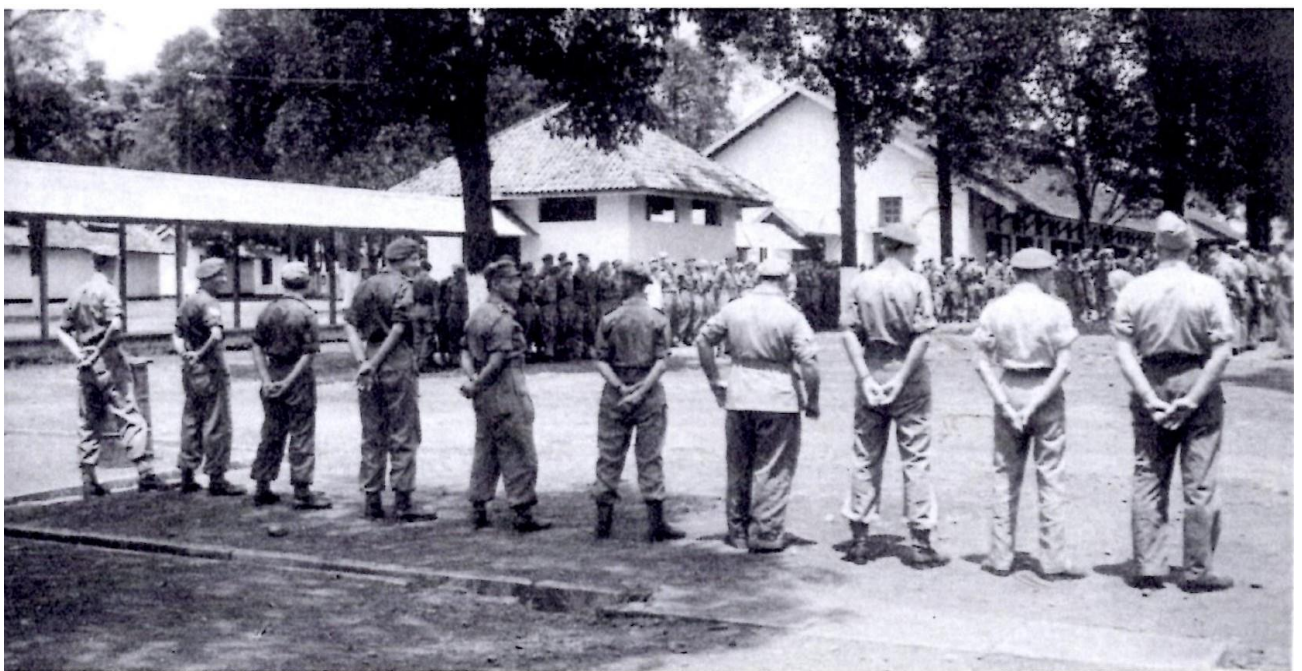
Generaal appel in de middag van 12 september 1950

De maand augustus verliep zonder veel bijzonderheden. De geruchten wanneer en met welke boot we terug zouden keren, werden steeds sterker. We kochten onze souvenirs en verkochten datgene wat we toch niet mee naar Holland terug wilden nemen. Uiteindelijk kwam de datum van inscheping toch nog vrij onverwacht. In september hoorden we opeens dat we op 12 september met de "Zuiderkruis" naar huis zouden varen. De "Zuiderkruis" was voor ons geen onbekend schip, want het was eenzelfde schip als de "Groote Beer", namelijk een Victory-schip. Omdat alle onderdelen die na ons gekomen waren al op de boot naar huis zaten, protesteerde kapitein De Boer tegen deze gang van zaken. Hij schijnt toen gezegd te hebben: "Mijn compagnie is geen taxicentrale, de jongens hebben er recht op naar huis te gaan". Nu kwam alles in een stroomversnelling. De doctoren kwamen naar de kazerne om ons nog een keer in te enten, er kwamen wagens met Hollandse uniformen, kortom allerlei activiteiten vonden er nu plaats in de kazerne. Ik denk ook dat wij een van de weinige onderdelen zijn geweest, die niet via kamp 'Makassar' of 'Berenlaan' naar Holland zijn gegaan.