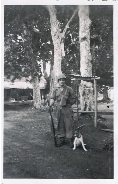
Op wacht met hond