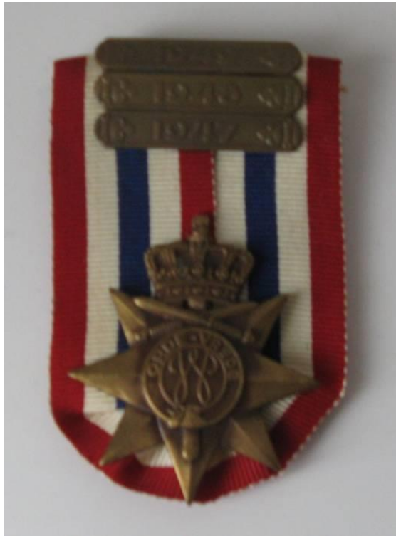
Ereteken voor Orde en Vrede met drie jaargespens