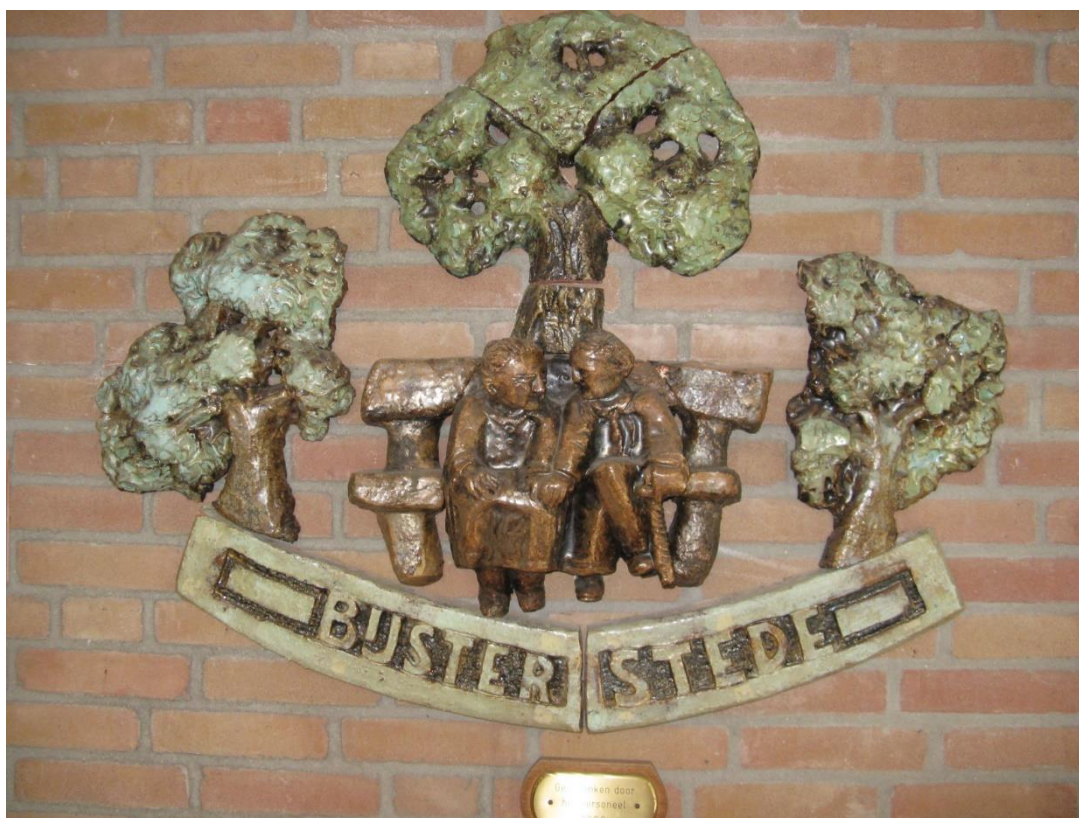
Woonzorgcentrum De Bijsterstede