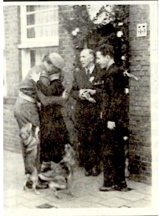
De ontvangst thuis