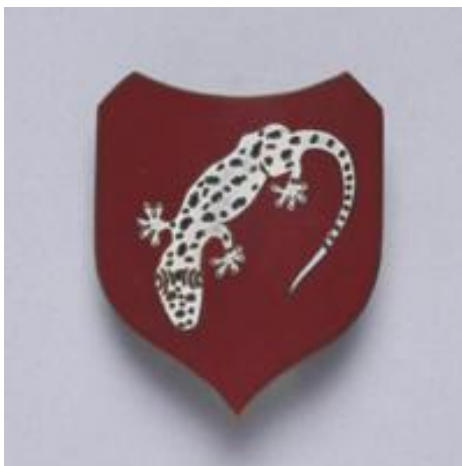
Embleem onderdeel 4-11 RI