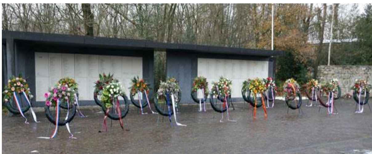
Dinsdag 7 december 2021, de 62 e herdenking van de "7 December Divisie"

Voor de tweede keer op rij een kranslegging zonder publiek maar met het door de Koninklijke Militaire Kapel Johan Willem Friso gespeelde Nightfall in Camp, de toespraak van de brigade-generaal, het signaal Taptoe, de saluutschoten, de kranslegging en tot slot het Wilhelmus toch een volwaardige en respectvolle herdenking.