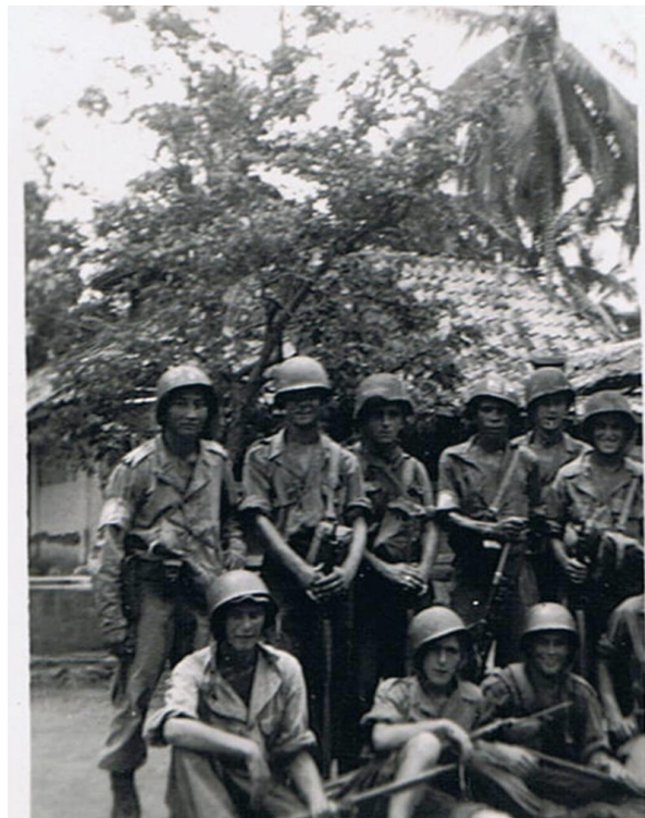
Terug van patrouille