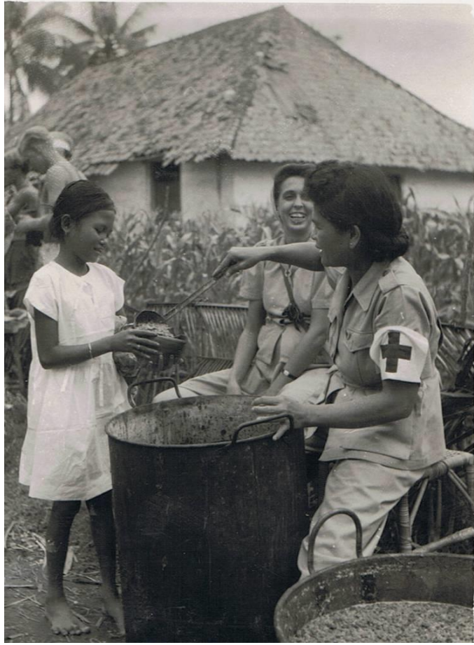
Rode kruis actief