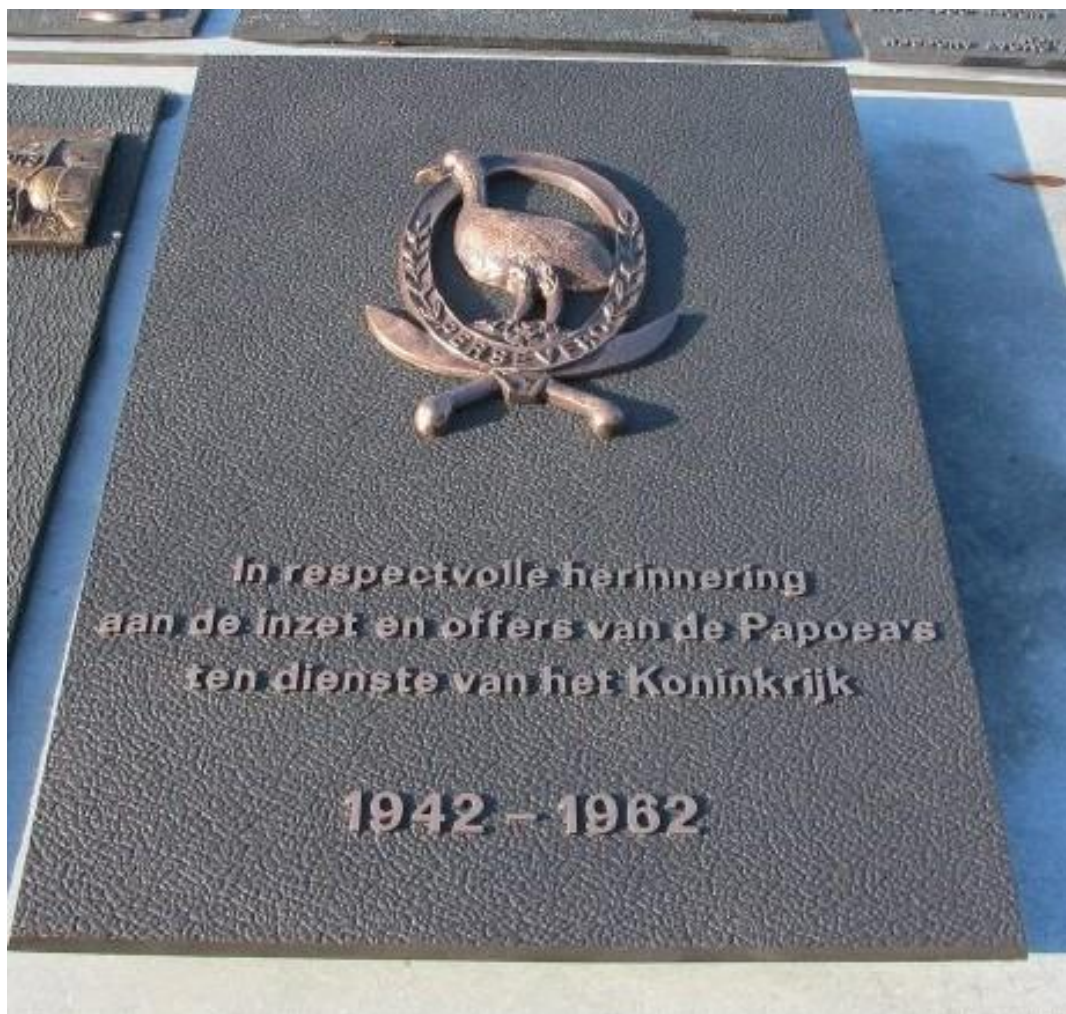
Plaquette in Roermond voor de offers van de Papoea's

We vulden elkaar dus prima aan. Soms voelden wij Papoea's trouwens wel een vorm van schuldgevoel en medelijden met die nieuw aangekomen militairen die het zo zwaar hadden. Met name de landmachtmilitairen waren immers vrijwillig helemaal uit Nederland gekomen om ons te helpen en als je met al die goede bedoelingen dan zó moet afzien. Een voorbeeld: als je op junglepatrouille gaat, dan is het slim om schoenen te dragen die een maat te groot zijn. Als gevolg van de werking van vocht en hitte krimpen die schoenen namelijk en als ze dus oorspronkelijk precies op maat waren, dan ga je op een enorme manier je voeten kapot lopen. Ondanks het feit dat we ze daarvoor wel waarschuwd, overkwam dat toch veel KL-militairen. En dan maar weer vloeken, natuurlijk !”