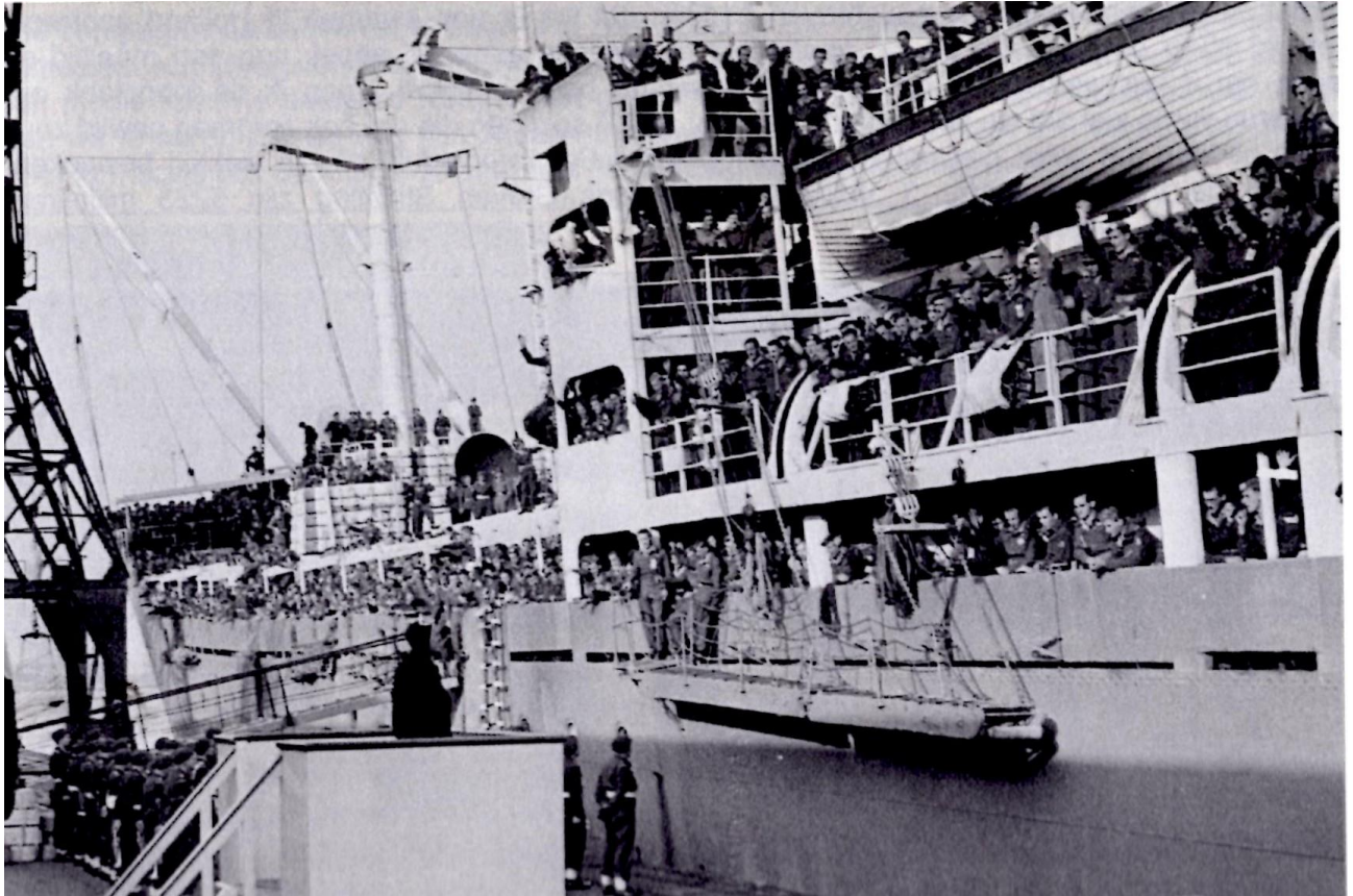
De ochtend van 9 oktober 1950. De "Zuiderkruis" ligt afgemeerd in Rotterdam. 42 AAT is terug in Nederland.